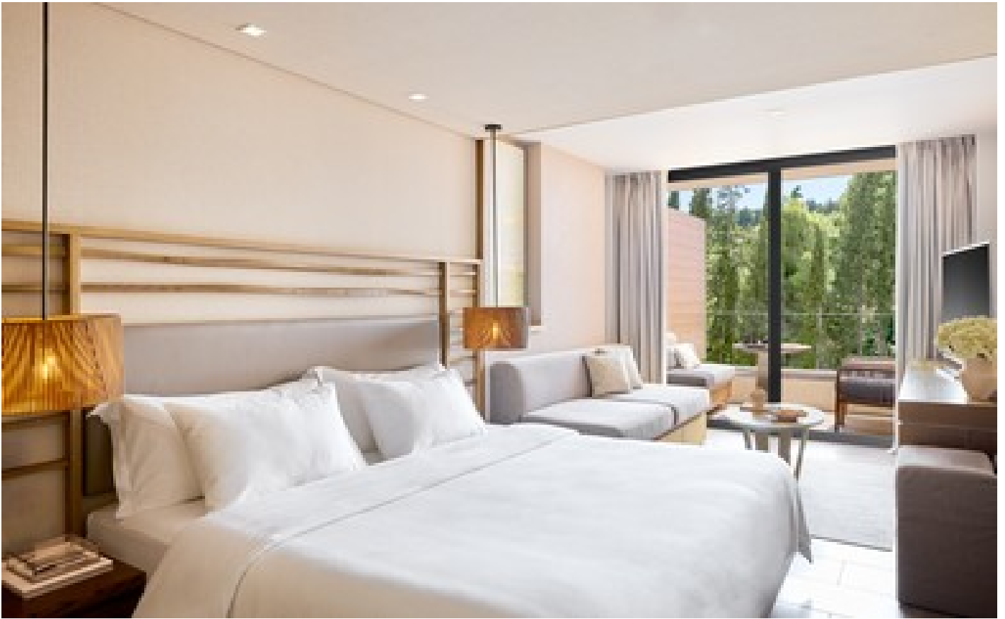
Ionian Seaview Grand Room