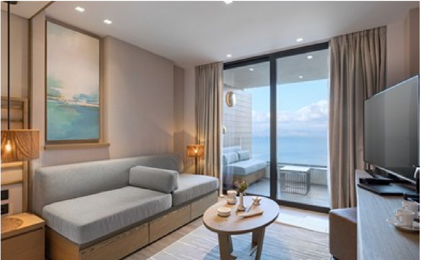
Achilleion Woodland View Family-Connecting Room