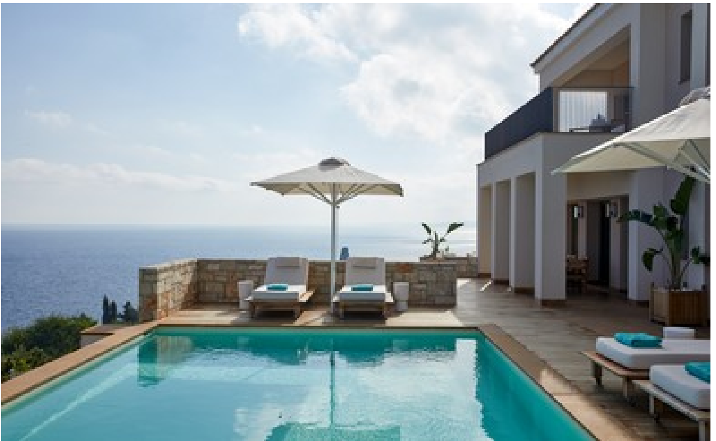
Ionian Seaview Four-Bedroom Pool Villa