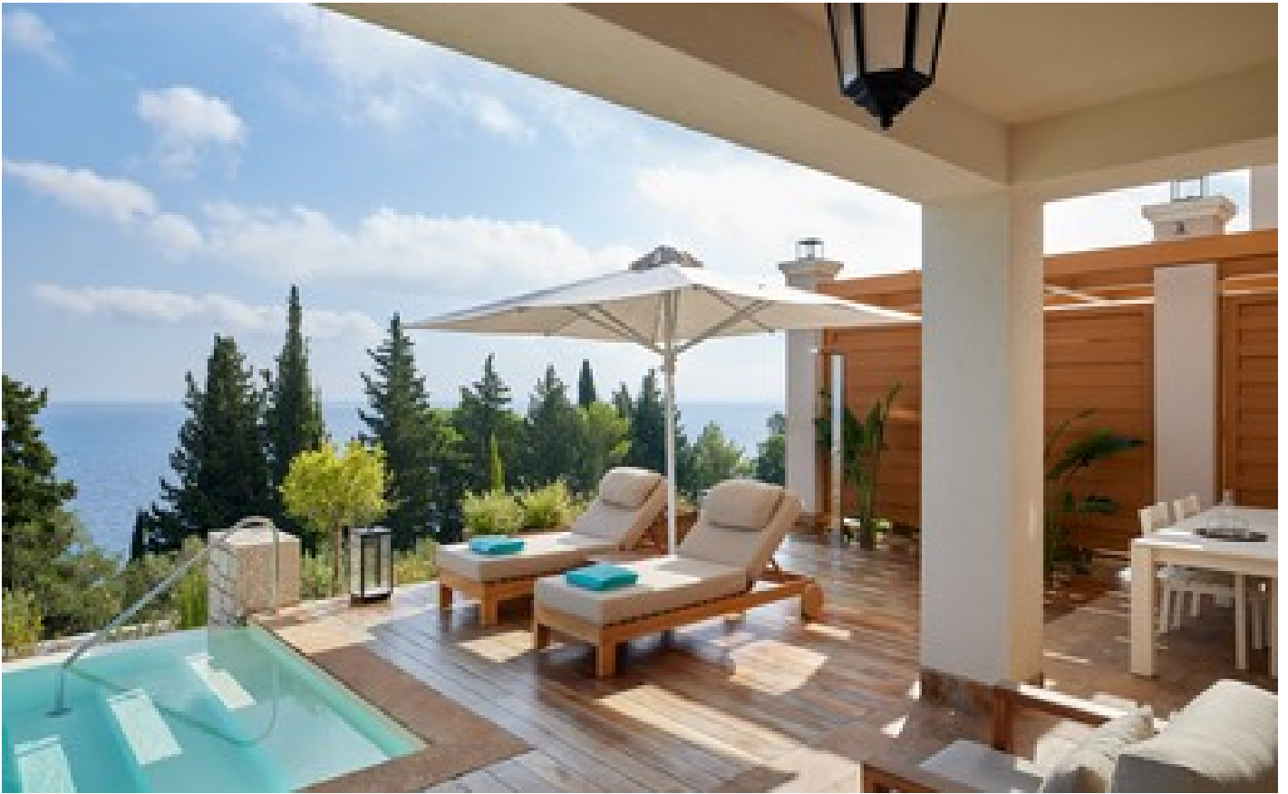
Ionian Seaview Three-Bedroom Pool Villa