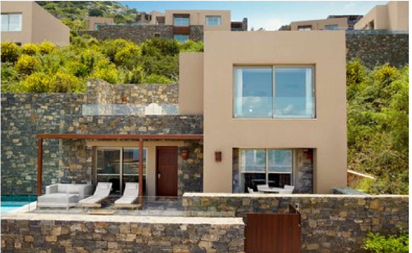
Three bedroom villa with private pool