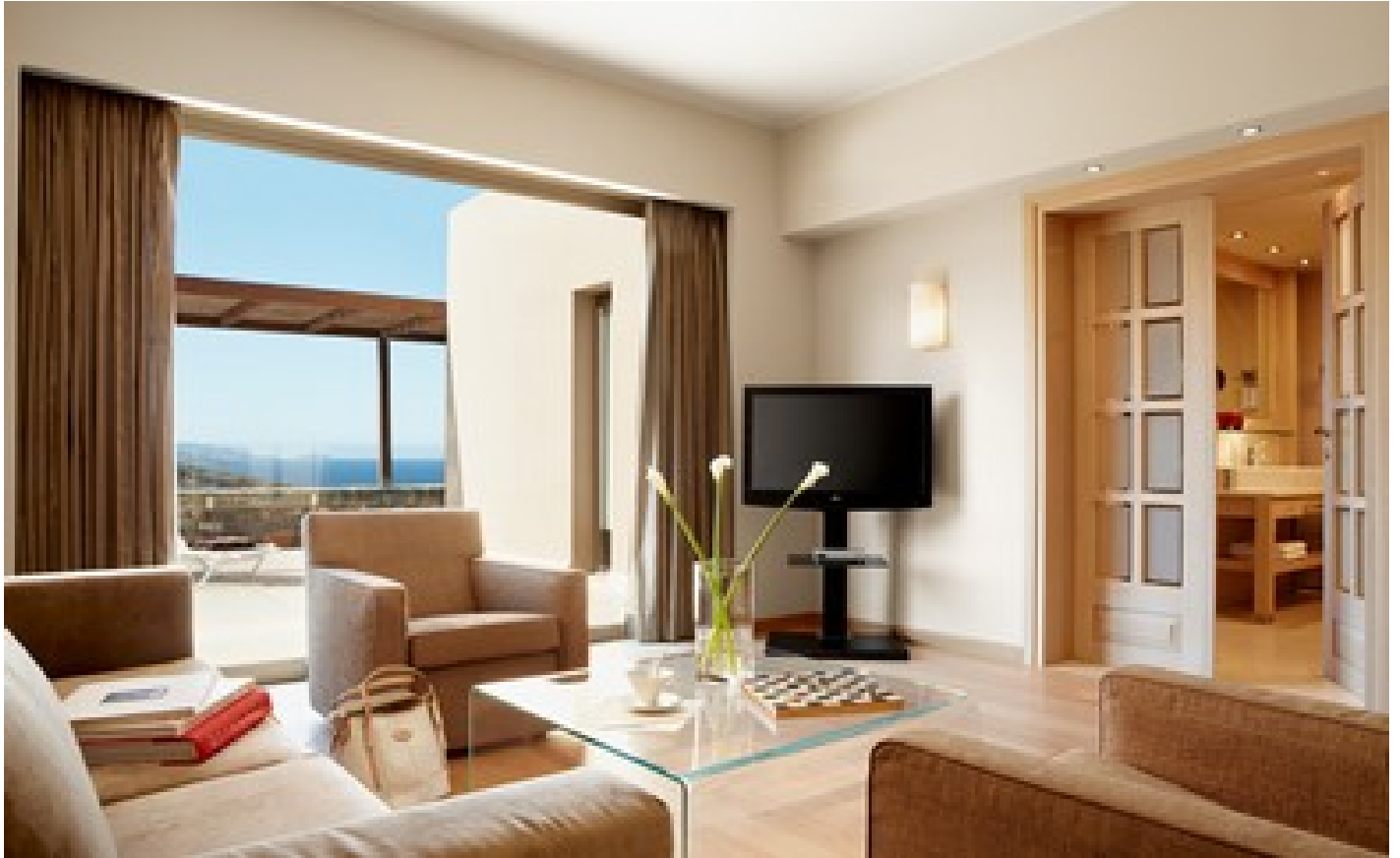
One bedroom suite sea view with private pool