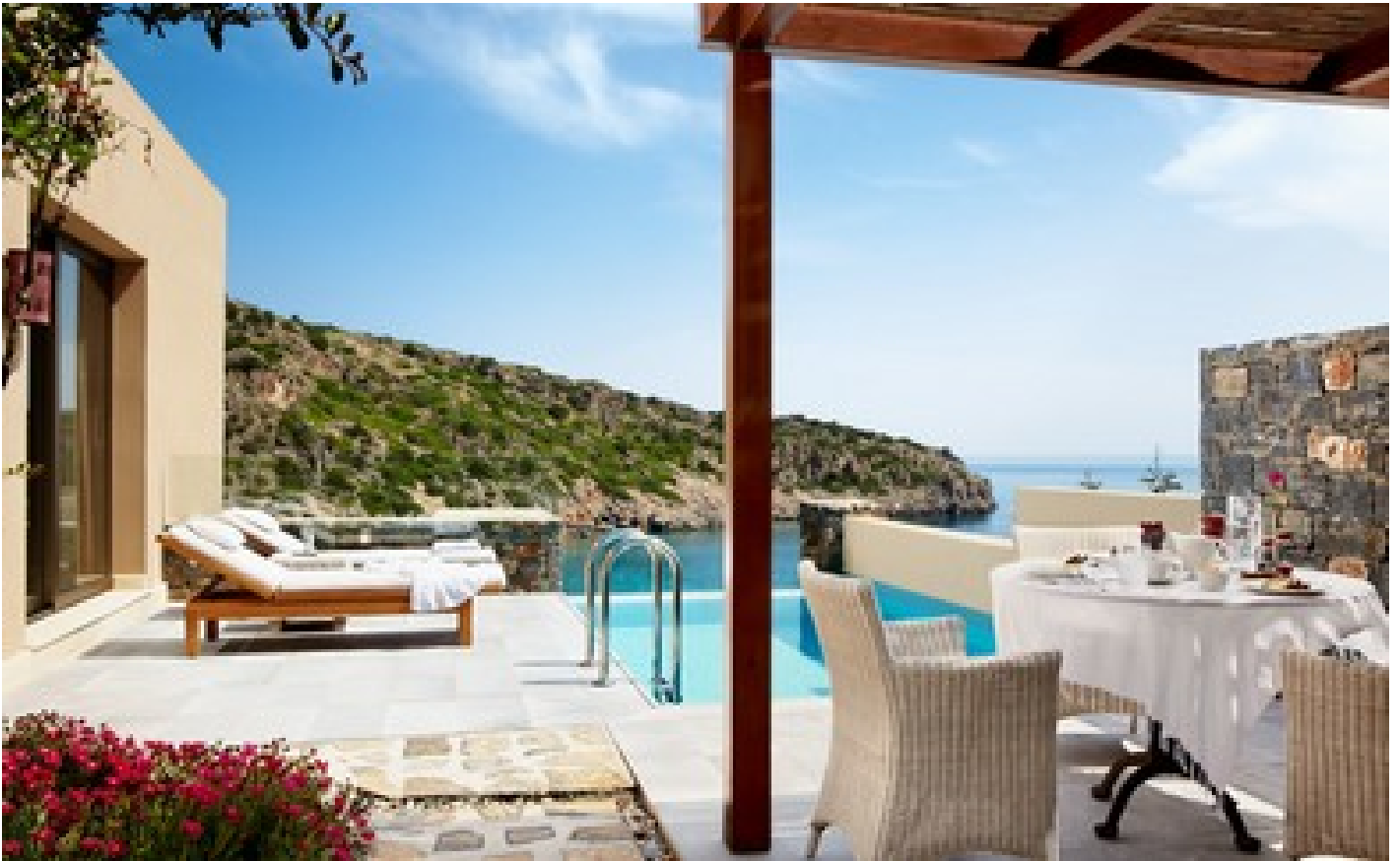
Two bedroom villa with private pool