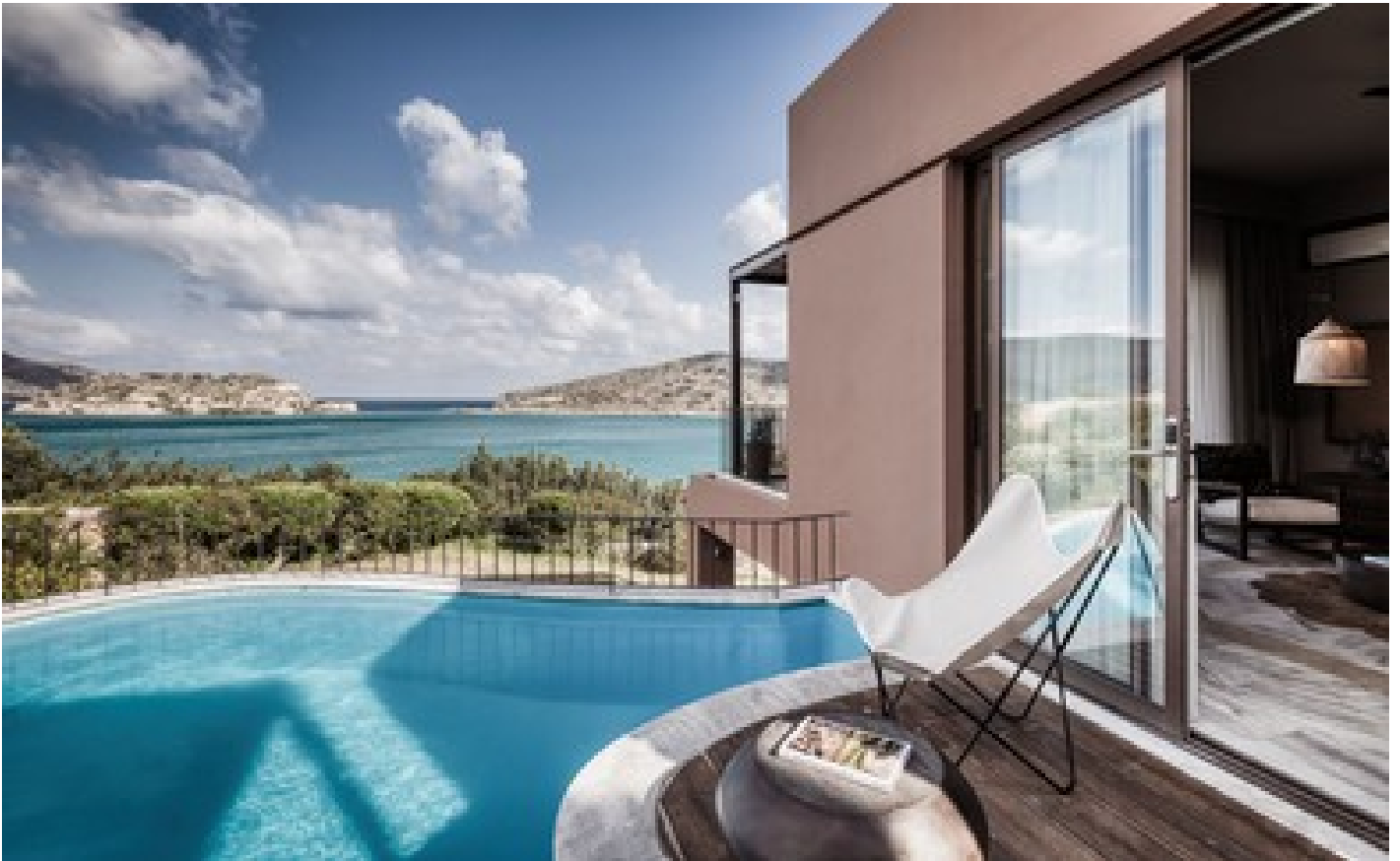
Family Suite GV with Outdoor Jacuzzi