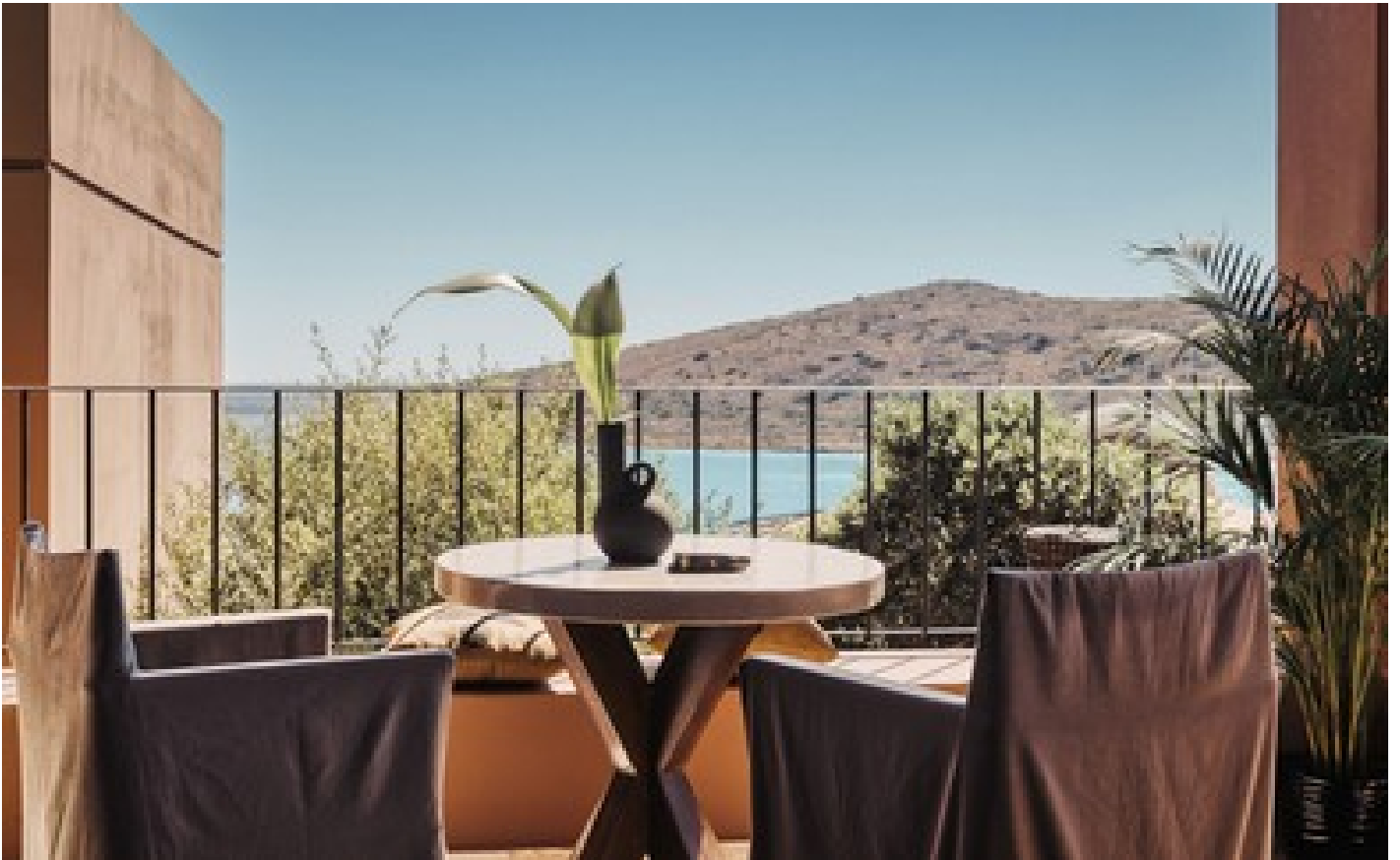
Family Suite SV with Private Pool