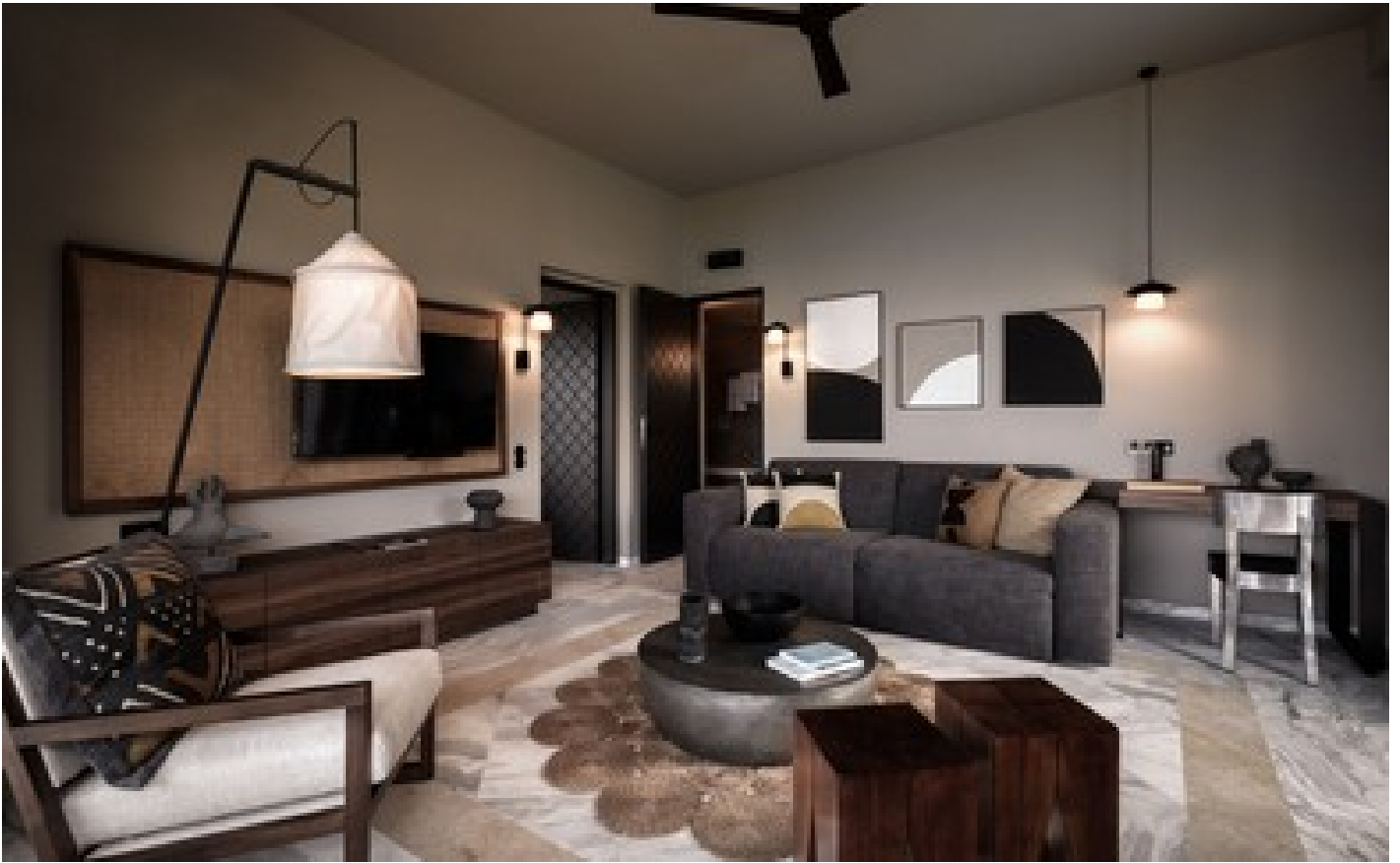
Premium 1 Bdr Suite, SV with Outdoor Jacuzzi