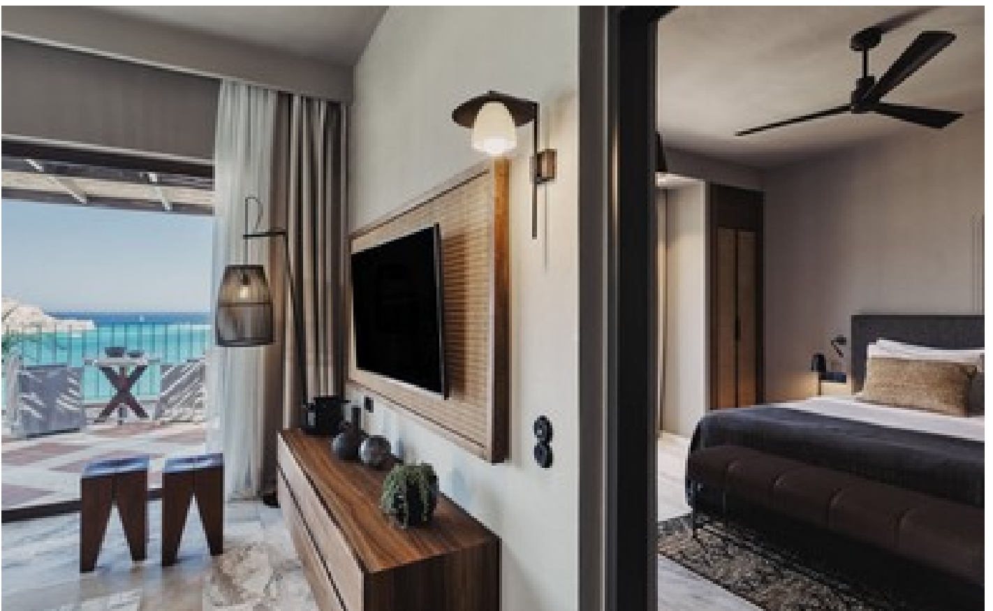
Luxury Family 2 Bdr Suite SV with Outdoor Jacuzzi