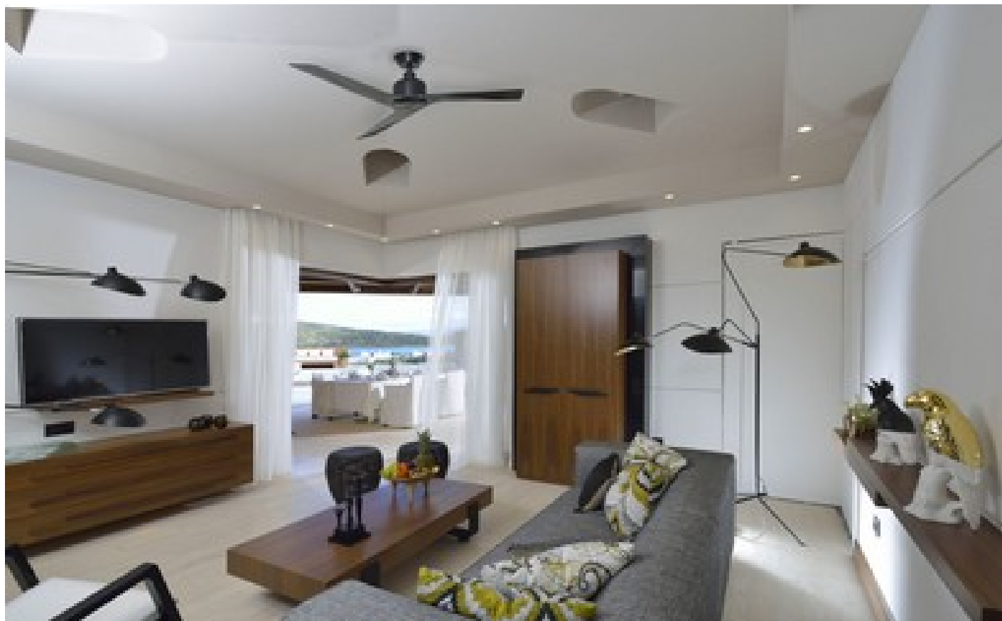
Luxury Residence four bedrooms with private pool