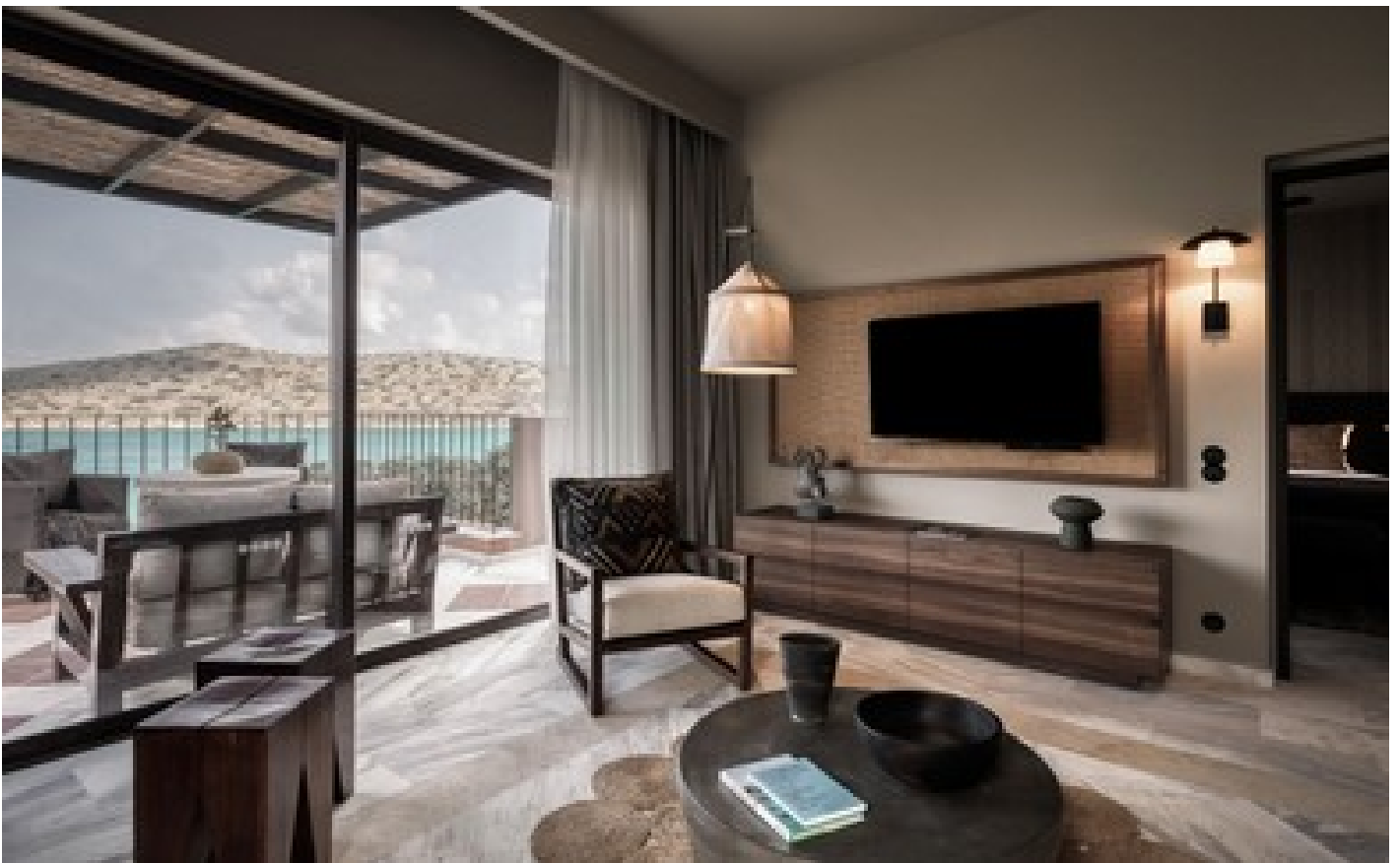
Premium 1 Bdr Suite, SV with Private Pool