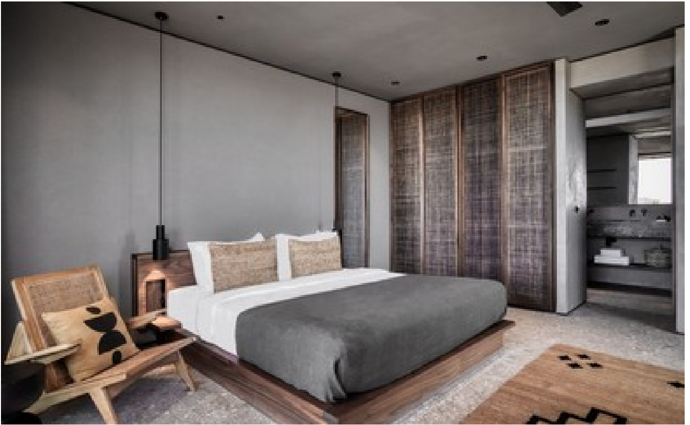
Tropical Family Bungalow Garden View