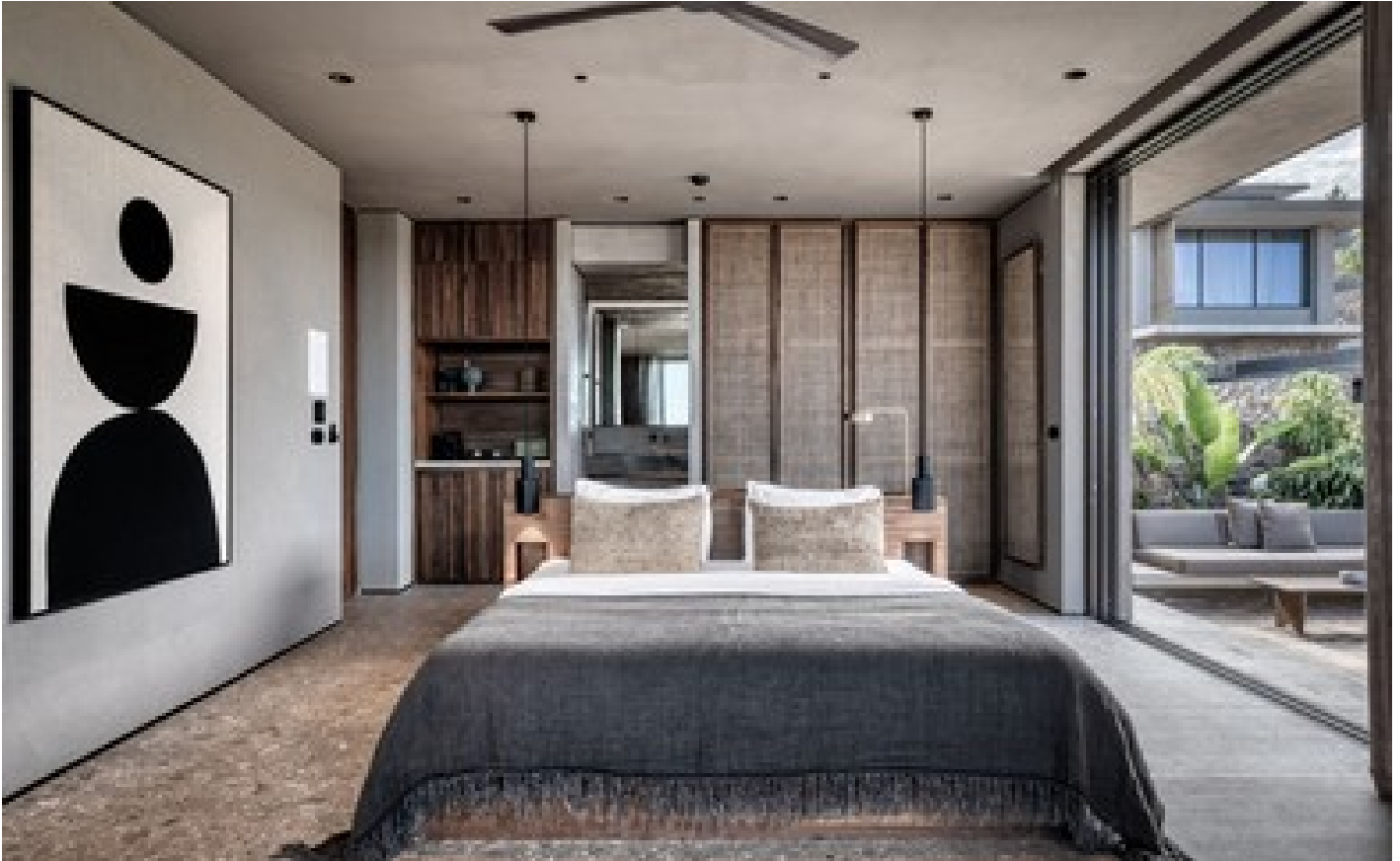
Sapphire Family Pavilion Private Pool Sea View