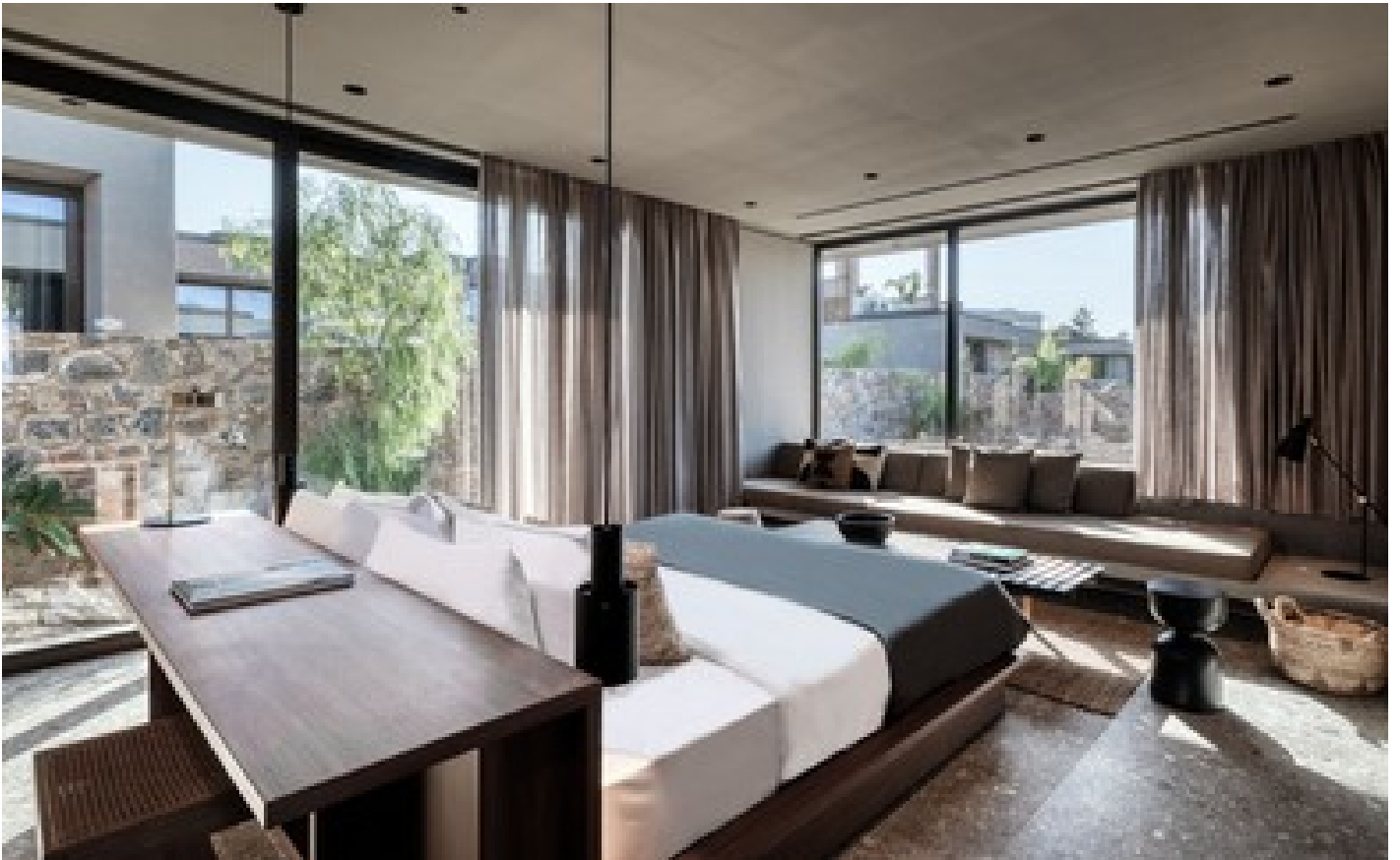
Tropical Family Room, Shared Pool Garden View