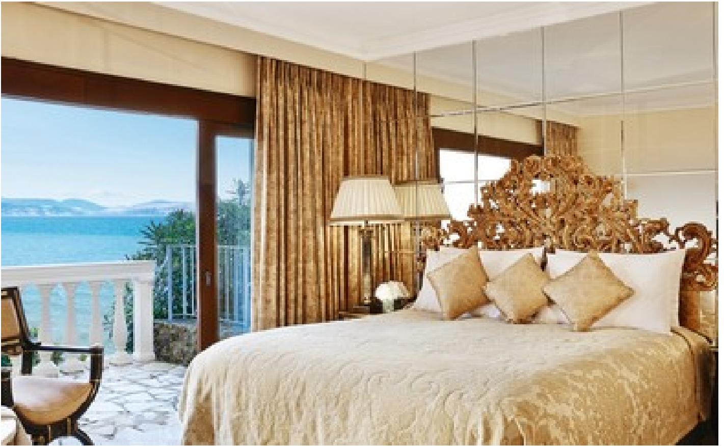
Dream Villa Beachfront Private Pool, 3 Bedroom Direct Sea View