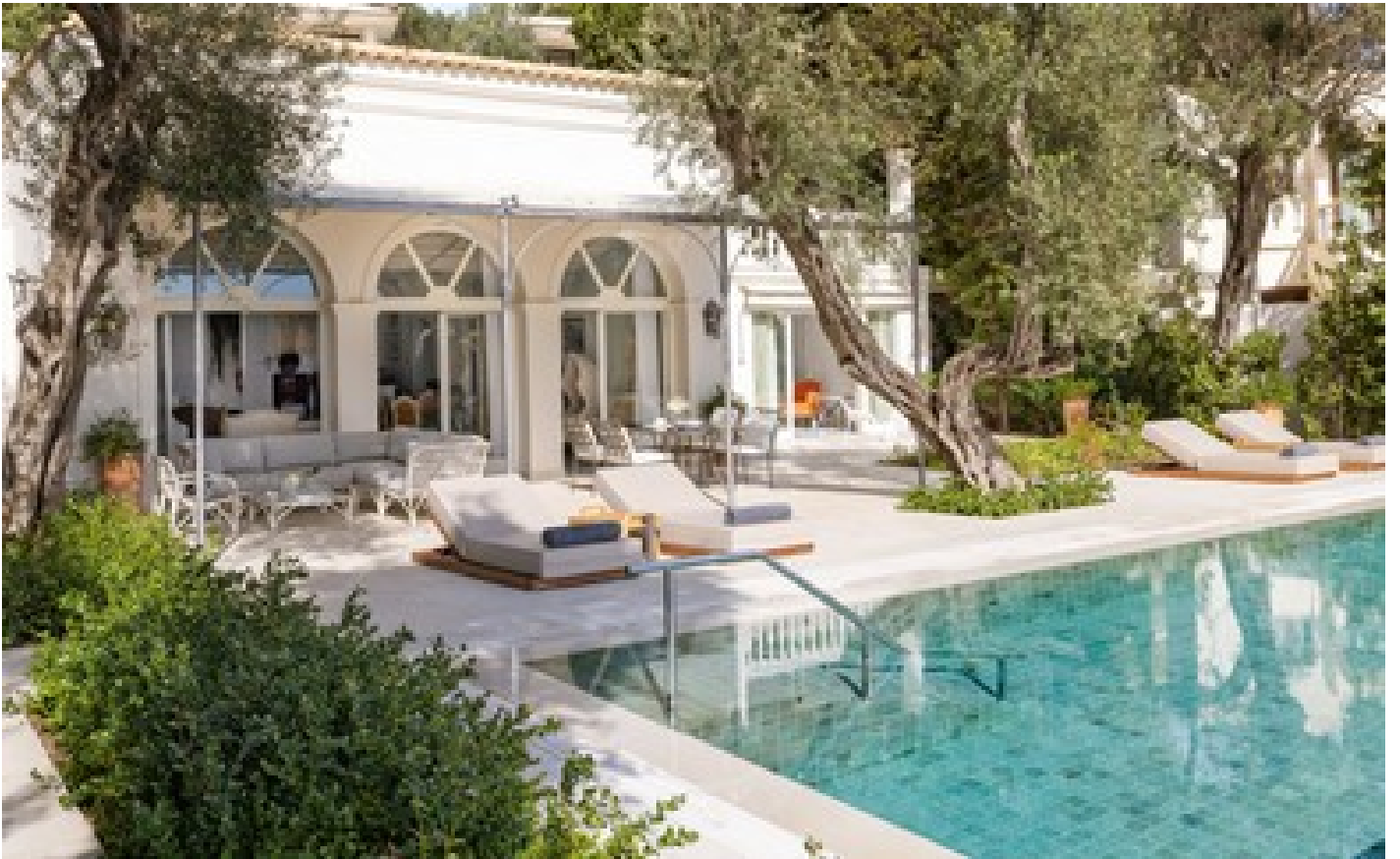
Palazzo Imperiale On Private Peninsula, 4 Bedroom Direct Sea View