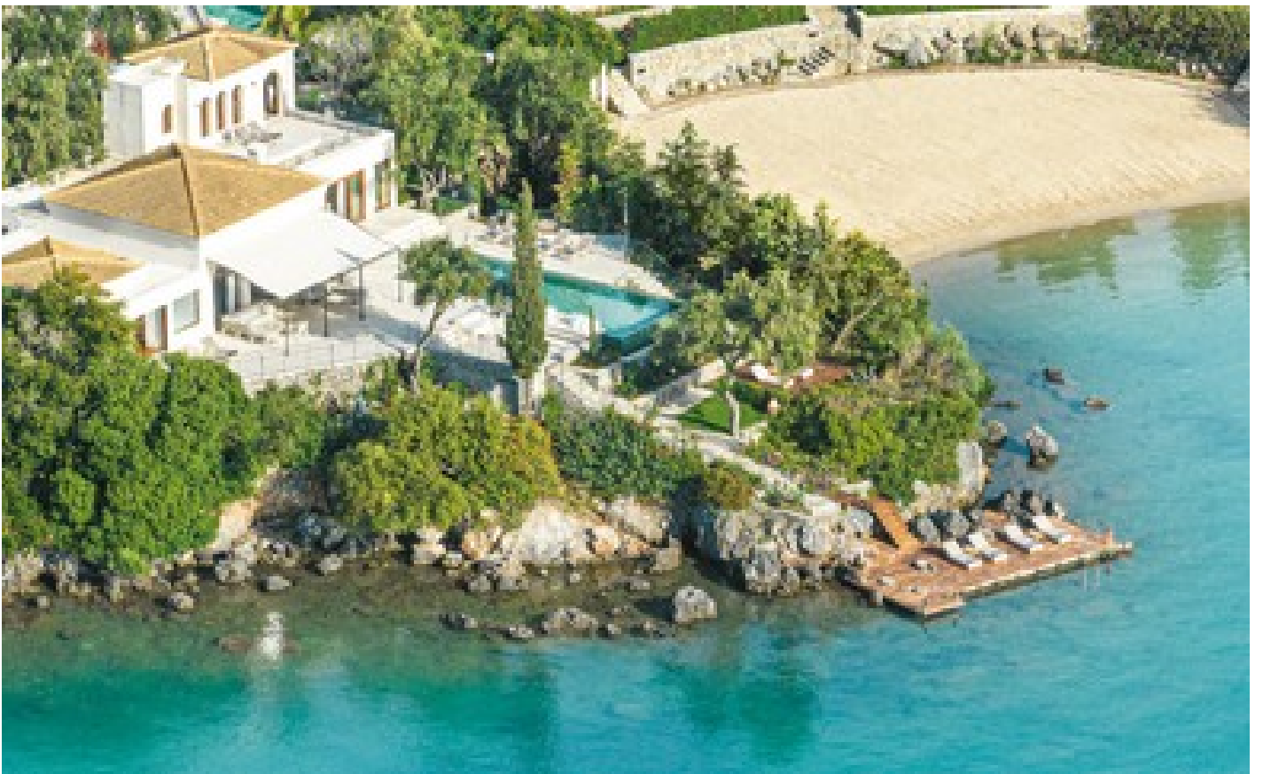
Medusa Estate Panoramic View