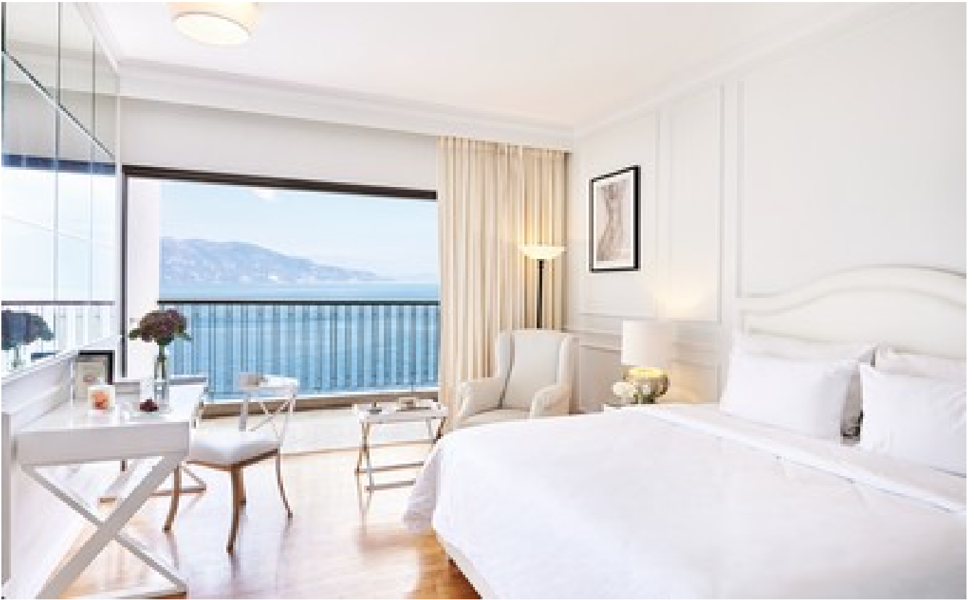
Cruise Guestroom Sea View