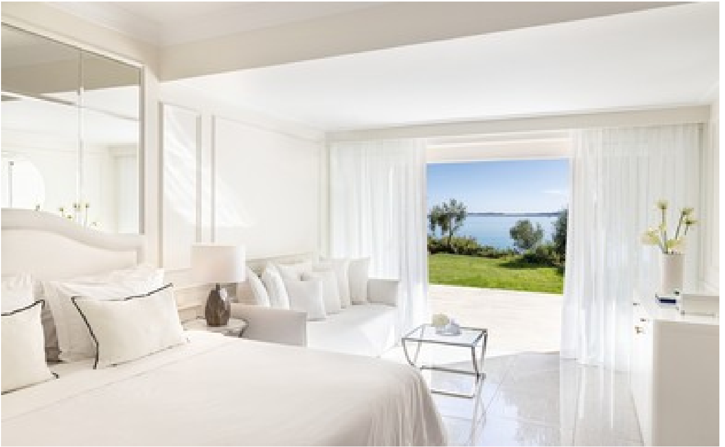
Junior Bungalow Suite Waterfront Direct Sea View