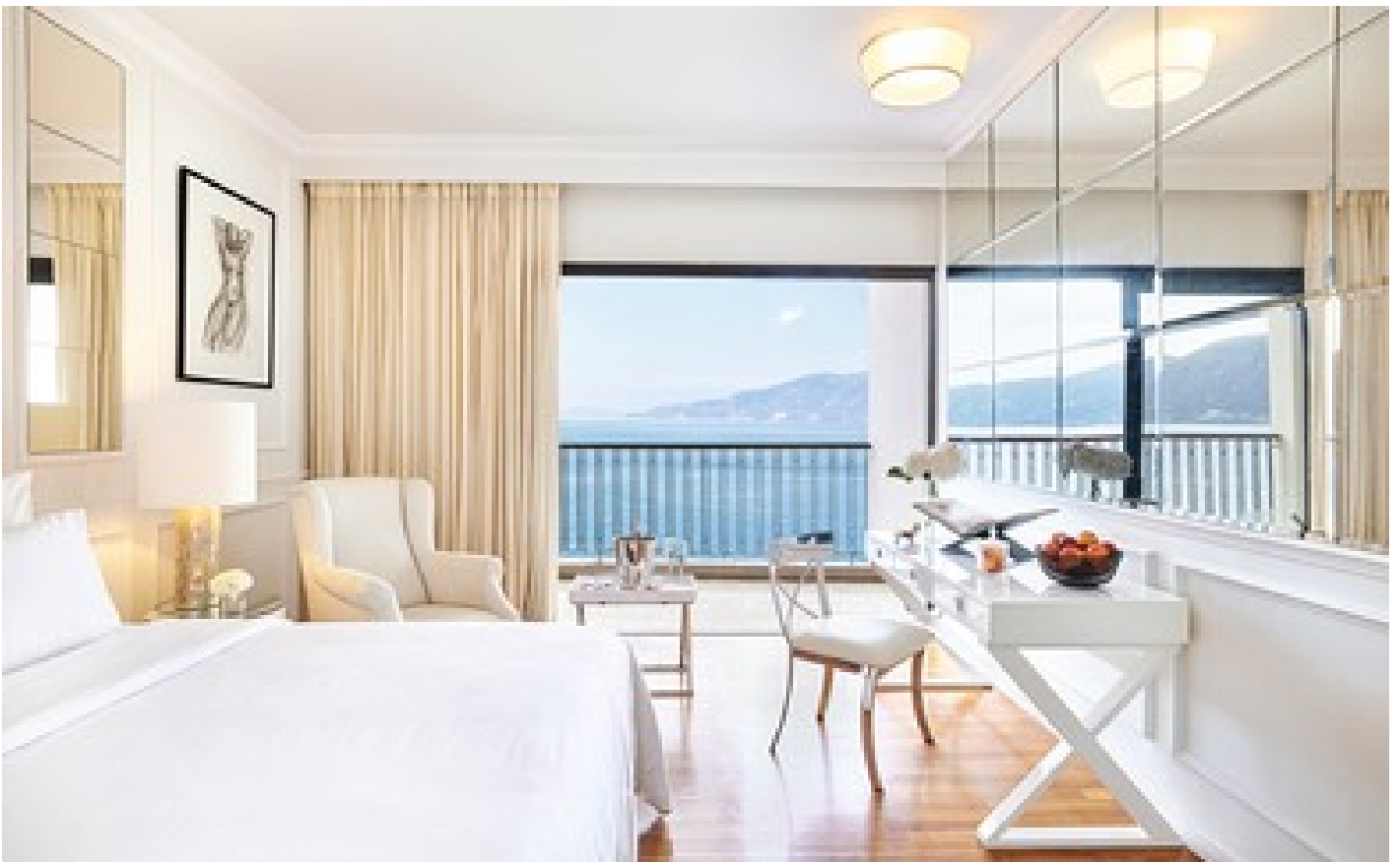
Deluxe Family Suite Sea View