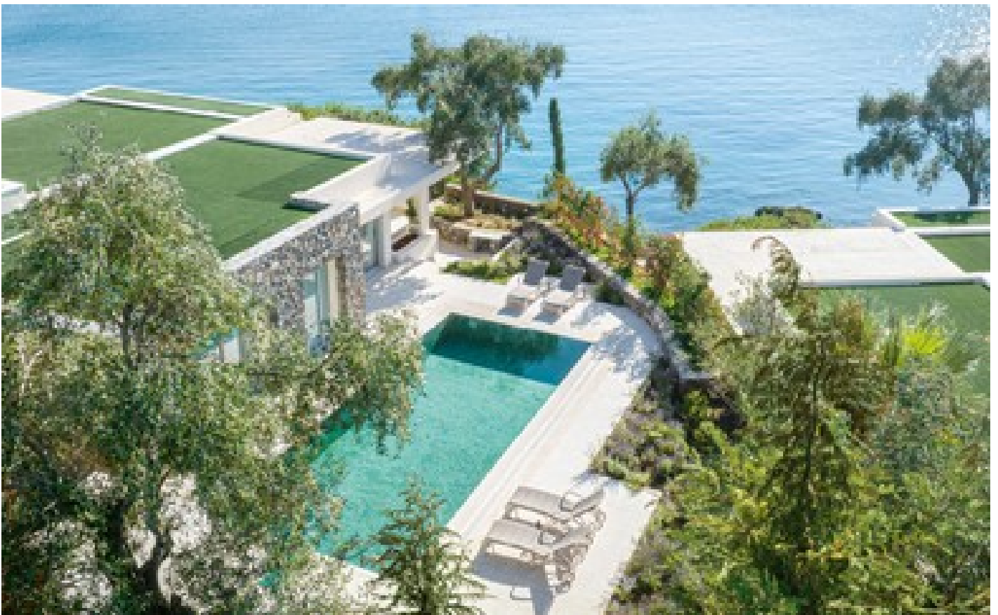
3-Bedroom Villa Waterfront Private Pool Direct Sea View