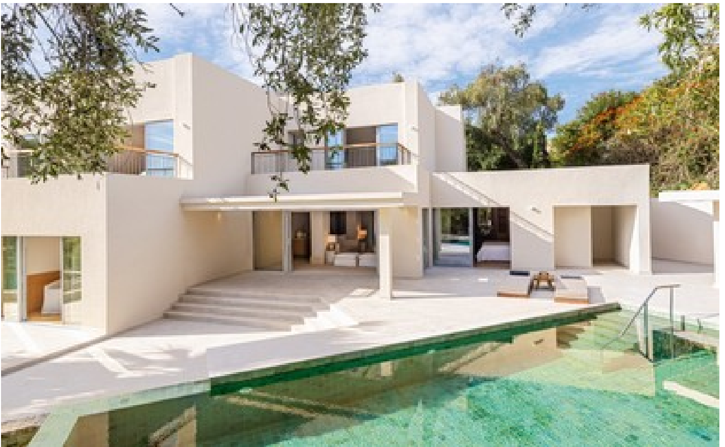
Dream Villa Beachfront Private Pool, 2 Bedroom + 1 Master Direct Sea View