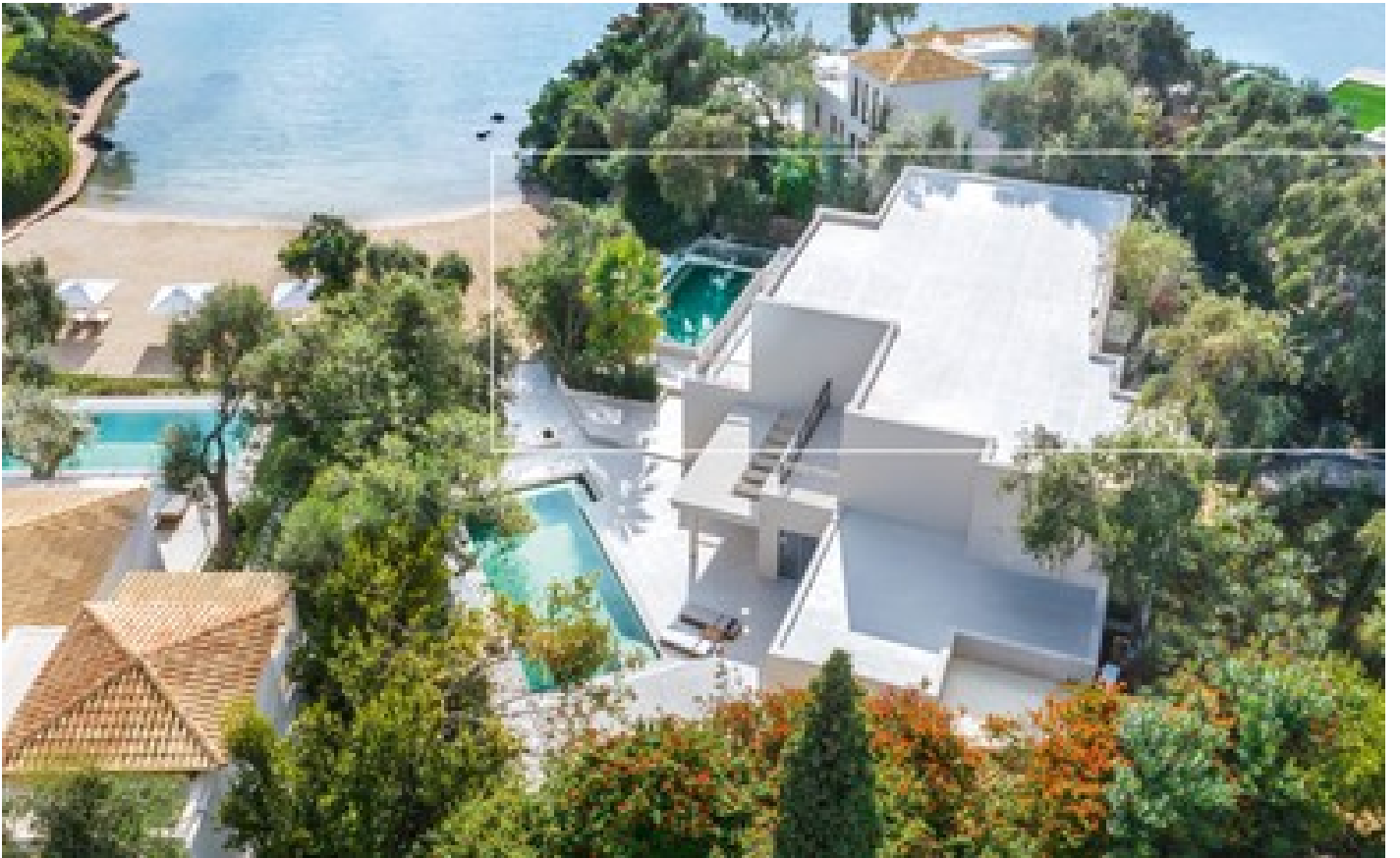
Royal Pavilion Private Pools, 6 Bedroom Direct Sea View