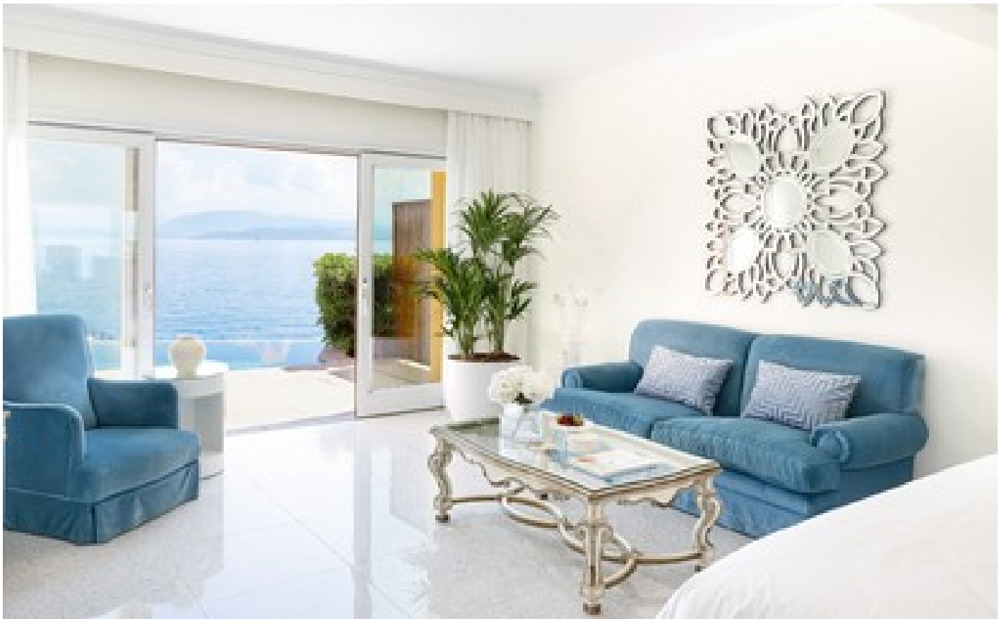
2-Bedroom Beachfront Villa Private Pool Direct Sea View