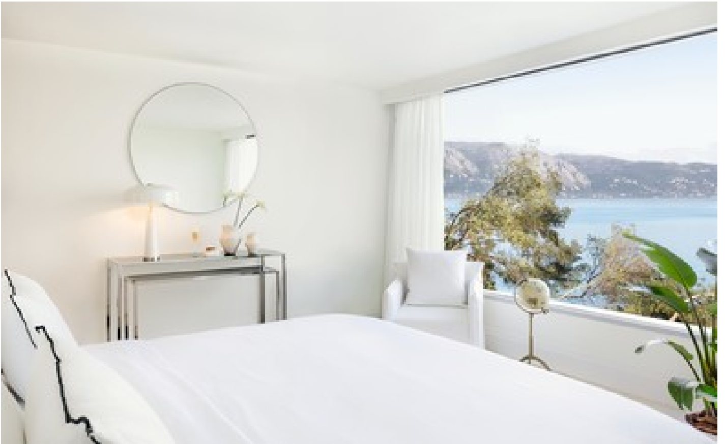
Maisonette on the Rocs Private Pool Direct Sea View