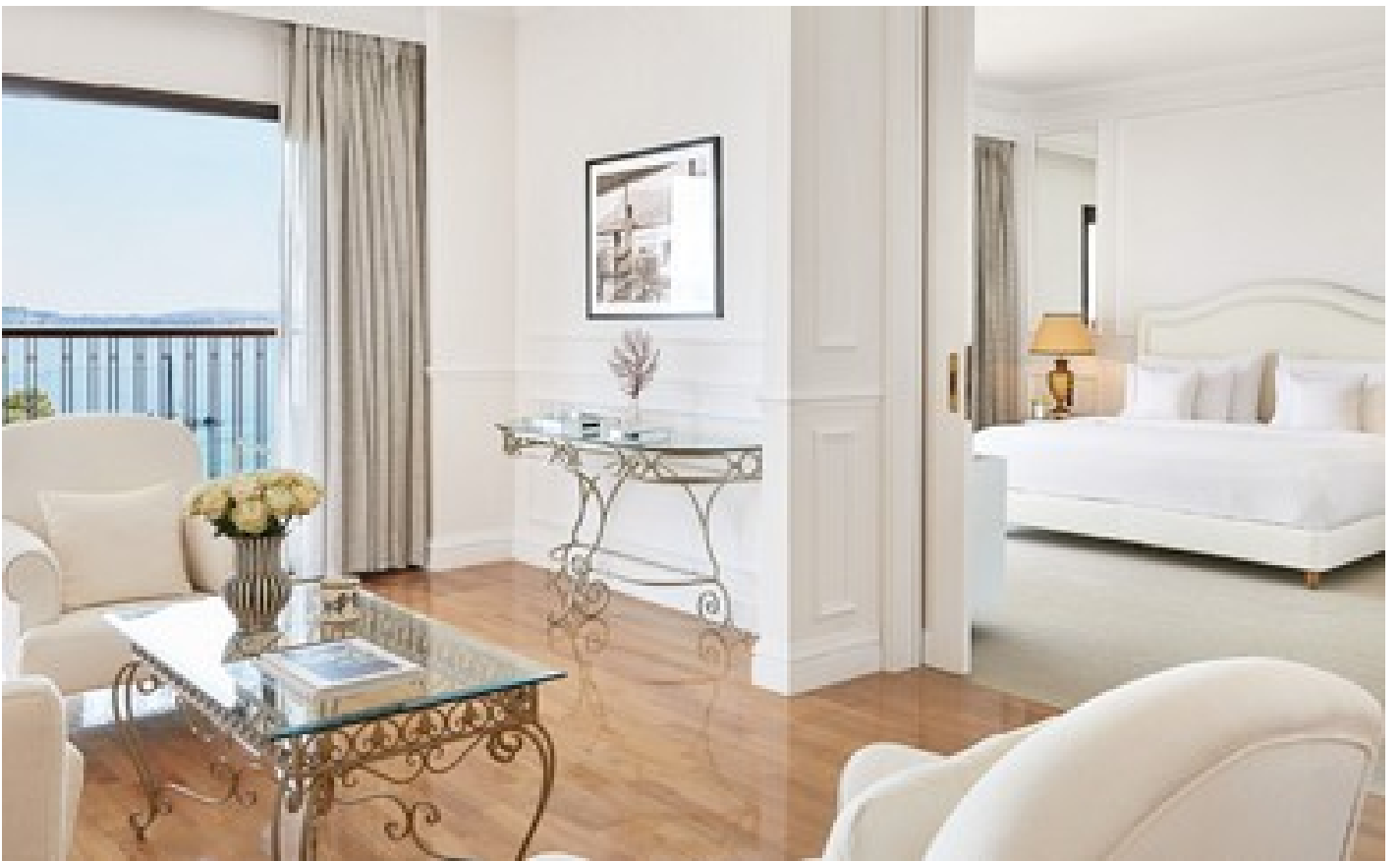
Imperial 2 Bedroom Suite Sea View