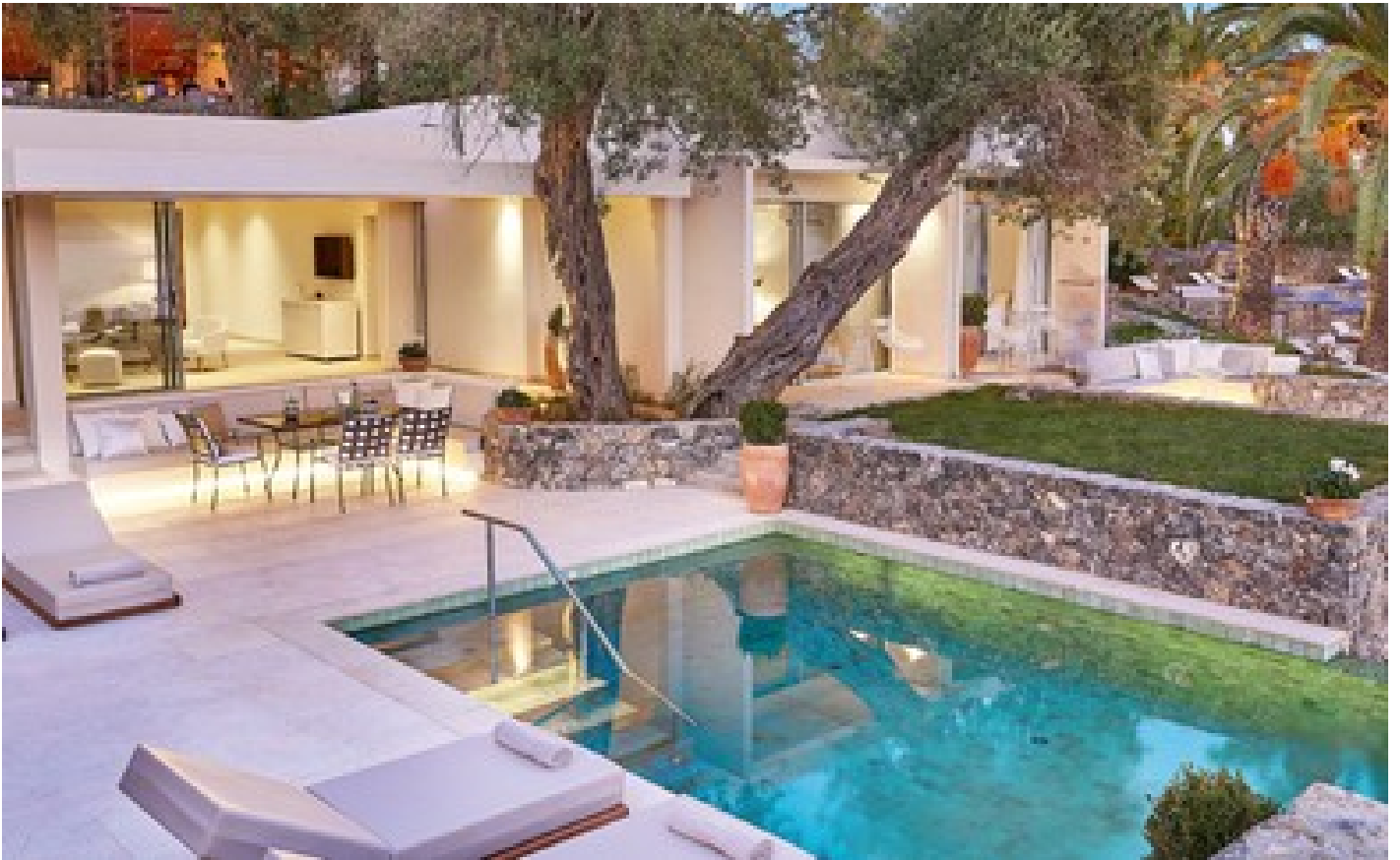
Two Villa Residence with Private Beach, 4 Bedroom Direct Sea View