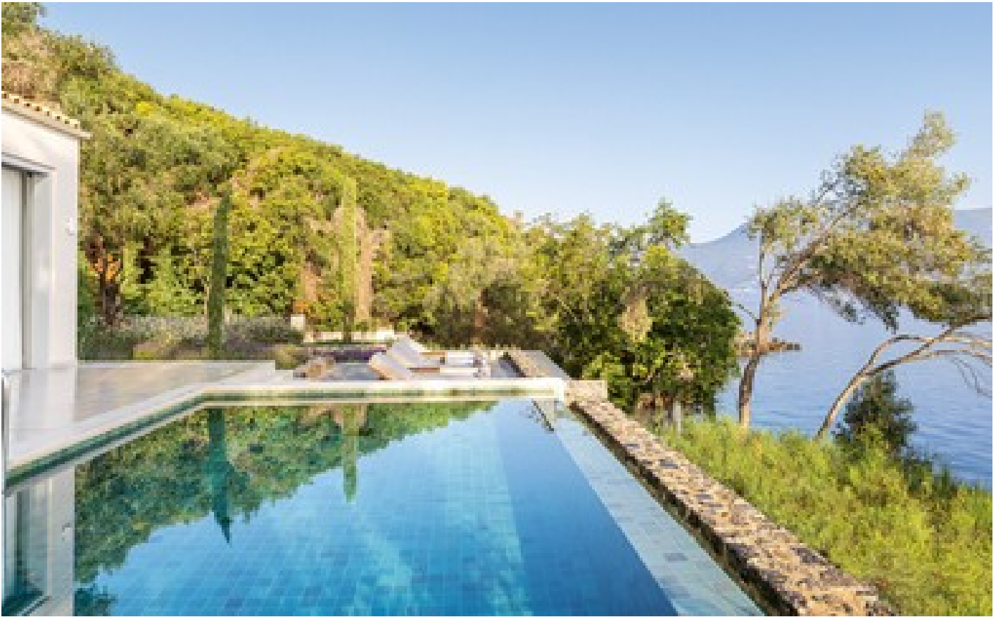
Palazzo Sissy Private Pool on the Rocs Direct Sea View