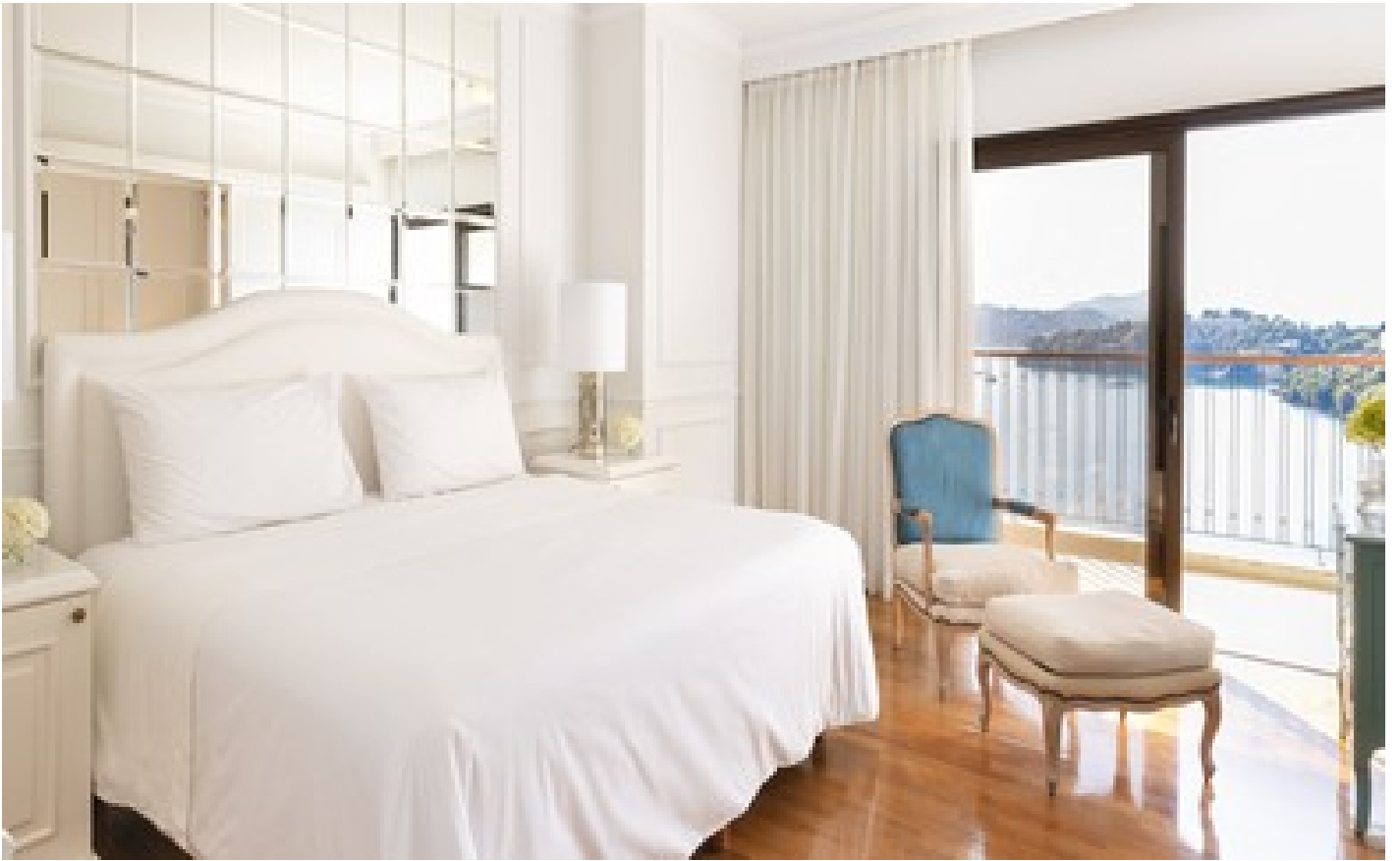
Imperial Suite Sea View