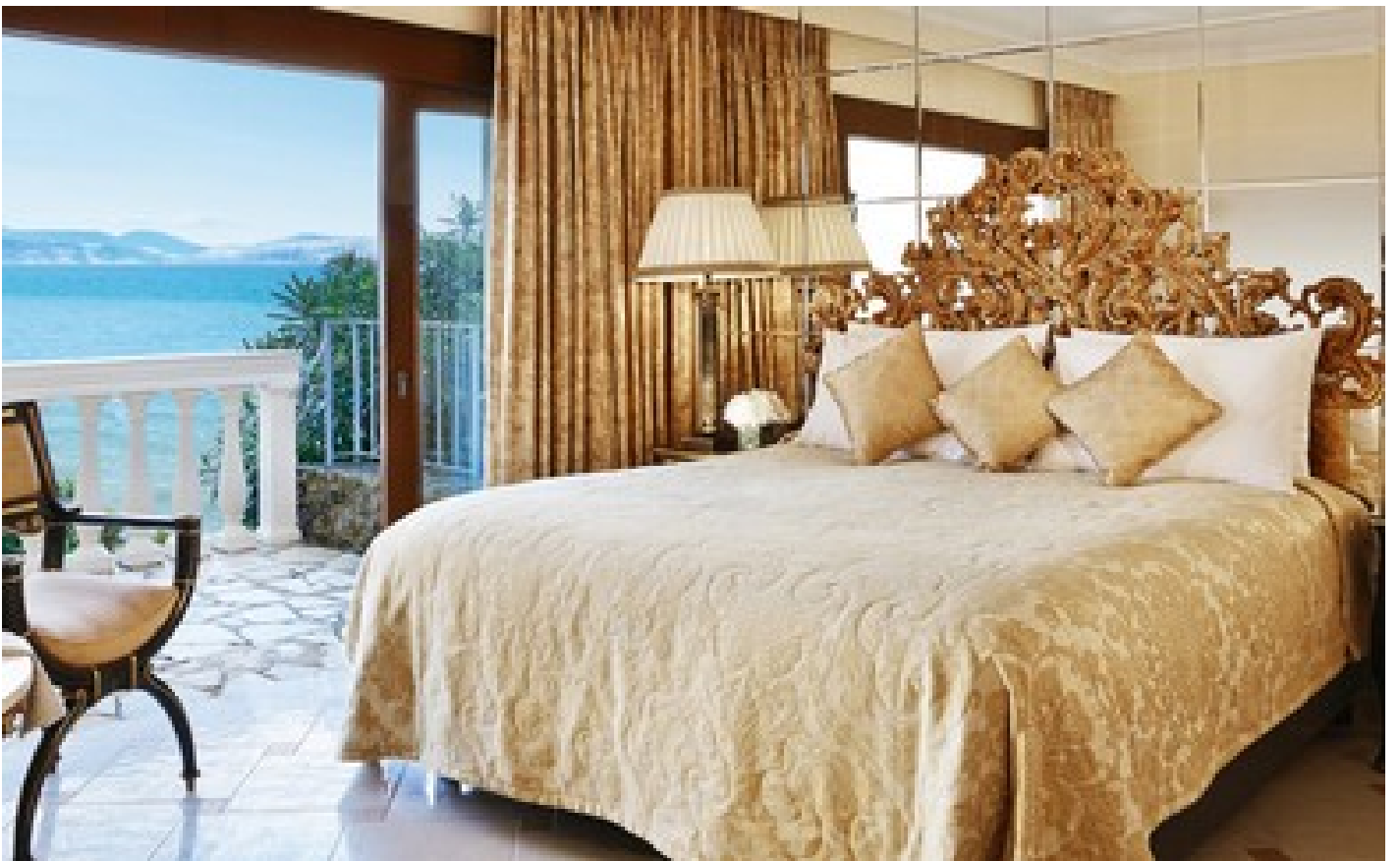
Palazzo Odysia Private Pool on the Rocs, 4 Bedroom Direct Sea View