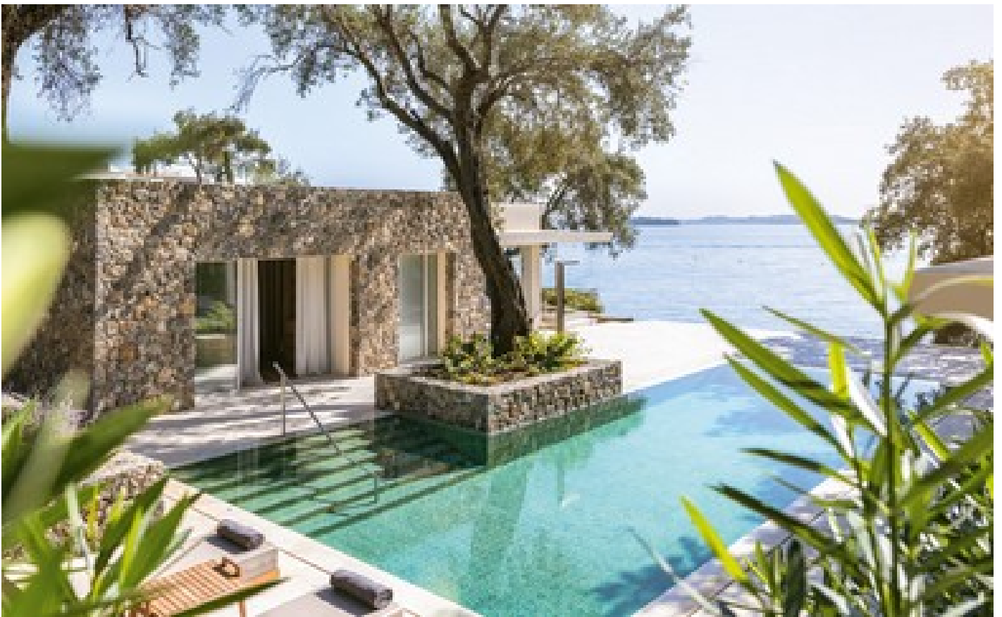
Palazzo di Lago Private Pool on the Rocs Direct Sea View