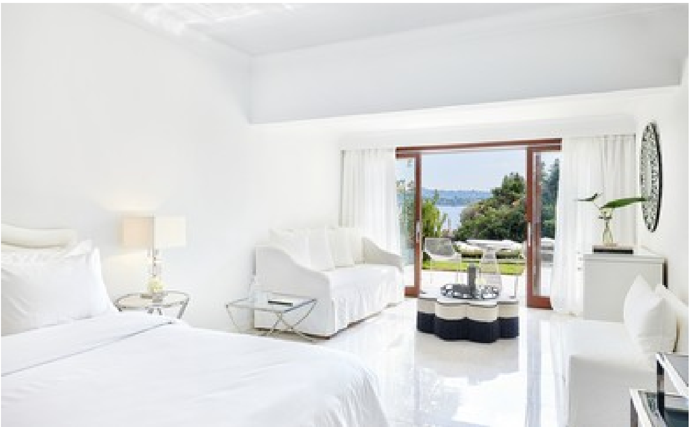
Maisonette on the Rocs Direct Sea View