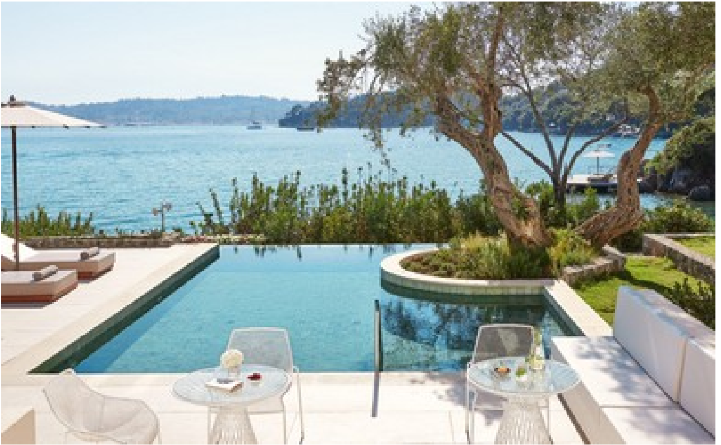
2-Bedroom Villa Waterfront Private Pool Direct Sea View