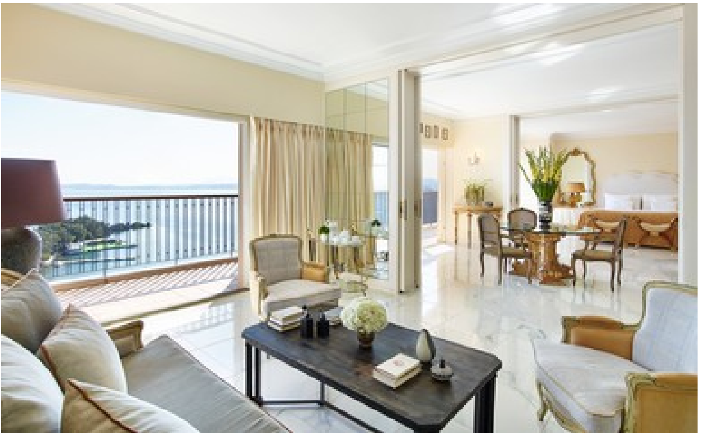
Deluxe Suite Sea View