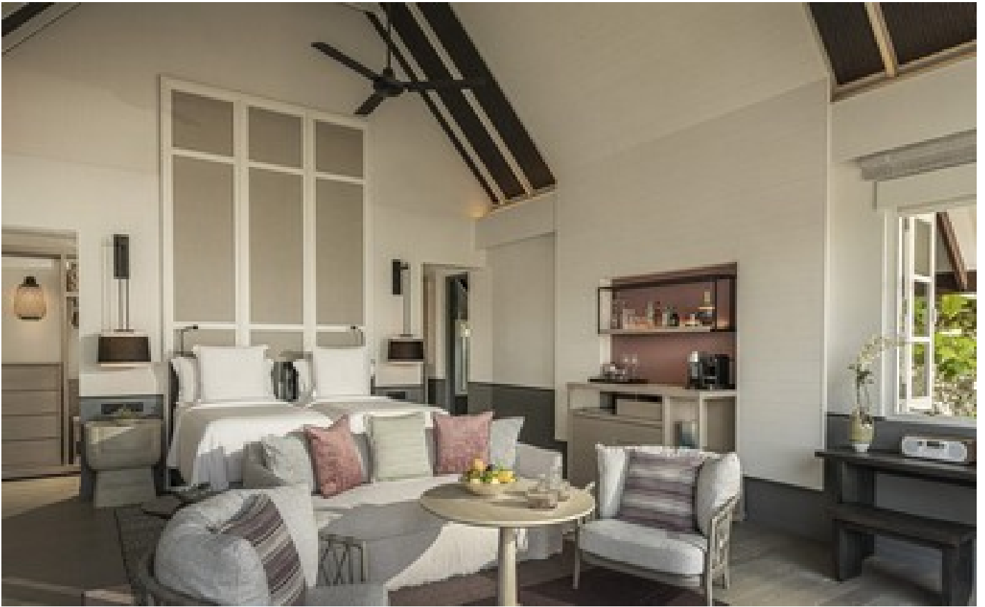
Two-bedroom oceanfront villa