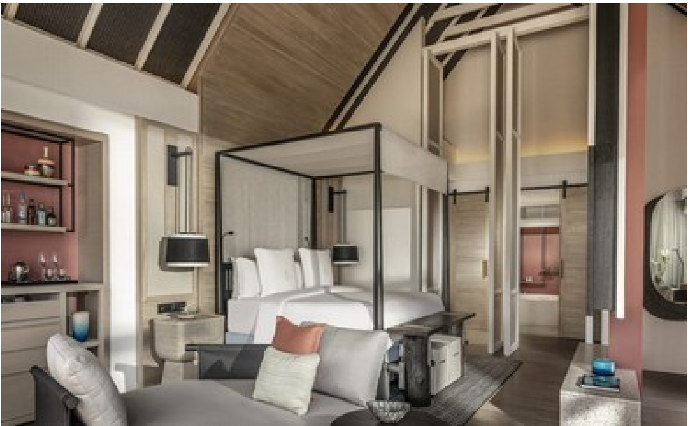
Beach Villa with Pool