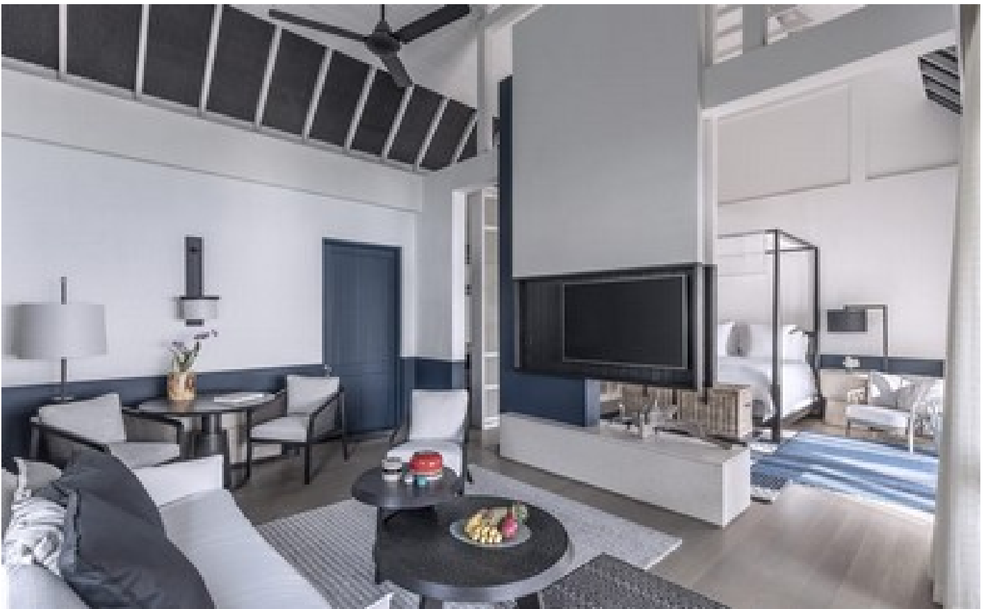
Premier Oceanfront Bungalow with Pool