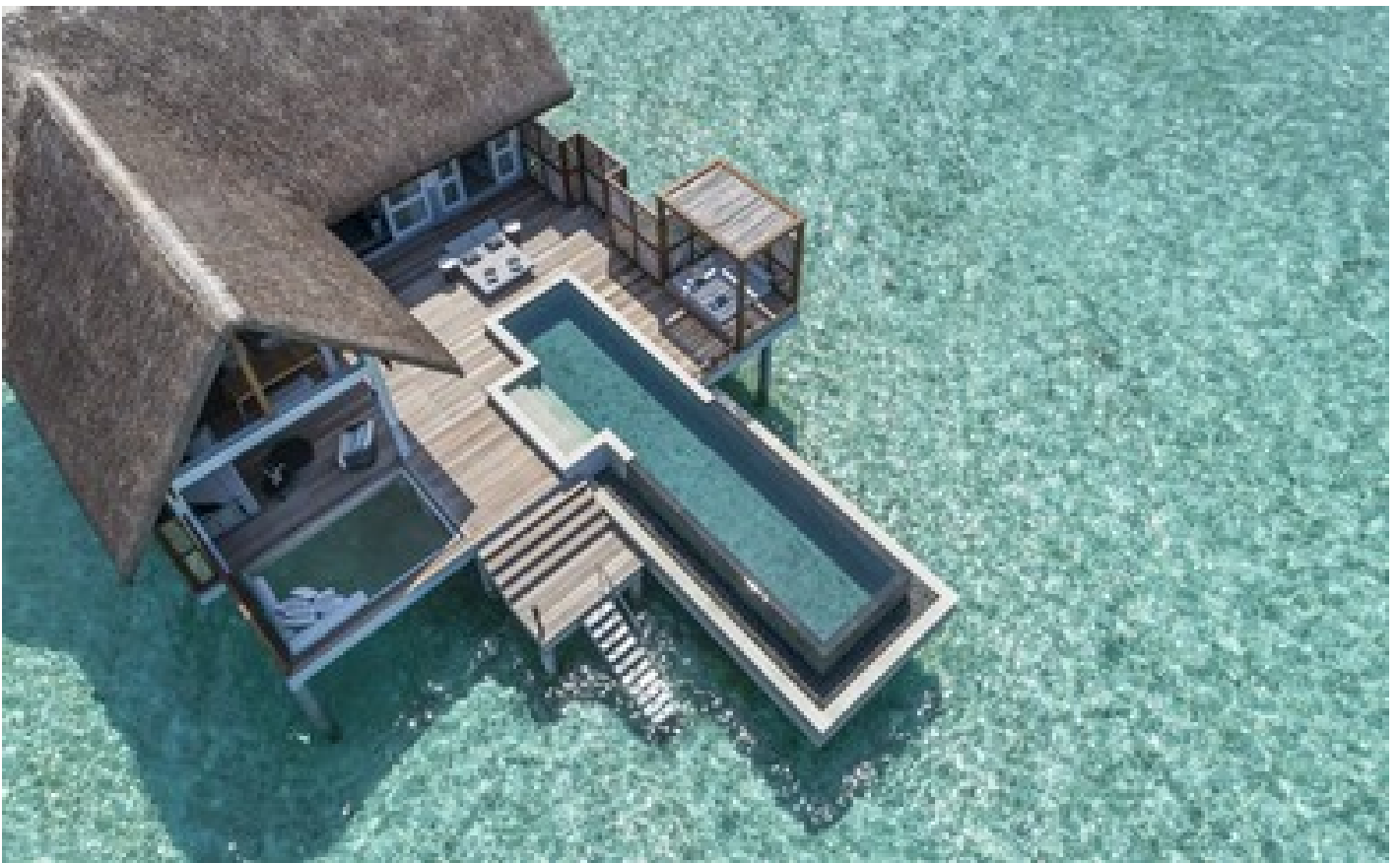
Sunset Family Water Villa with Pool