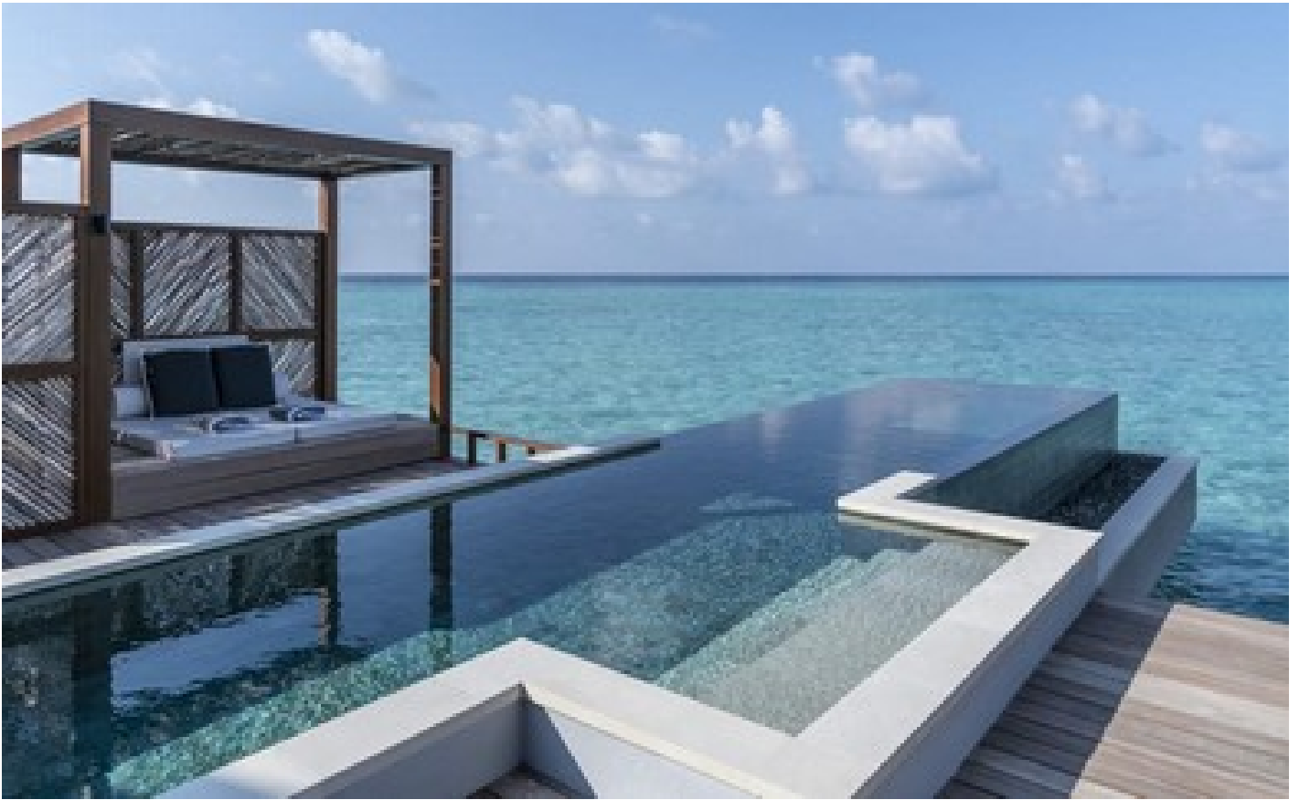
Water Villa with Pool - Partial Sea View