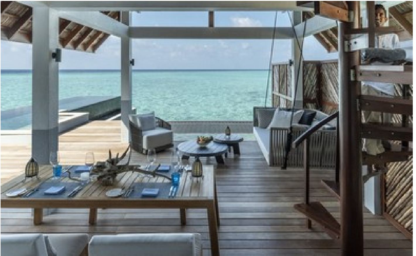
Sunrise Family Water Villa with Pool