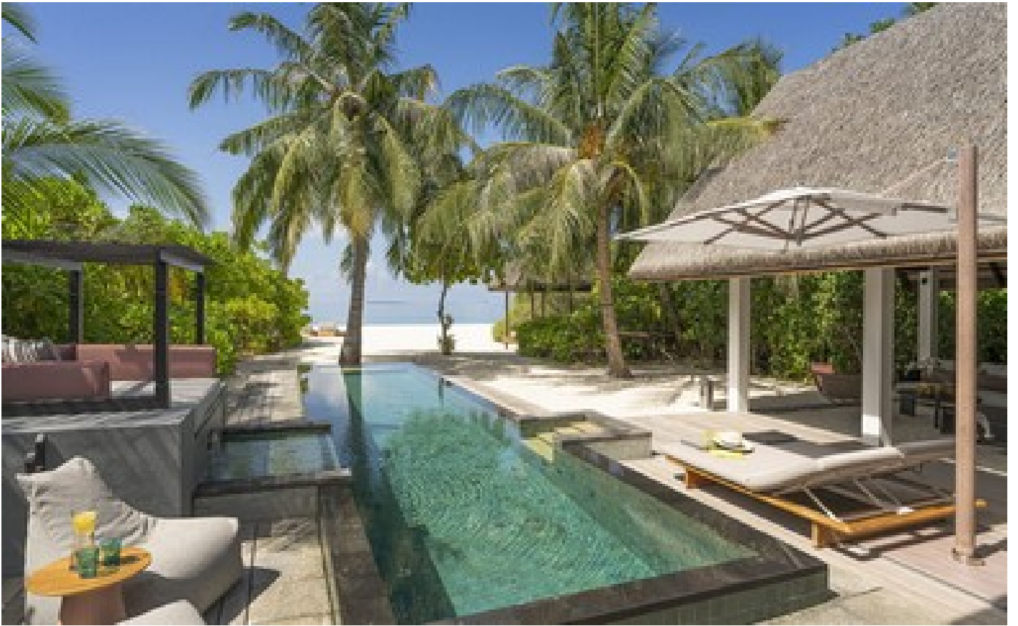
Family Beach Villa with Pool