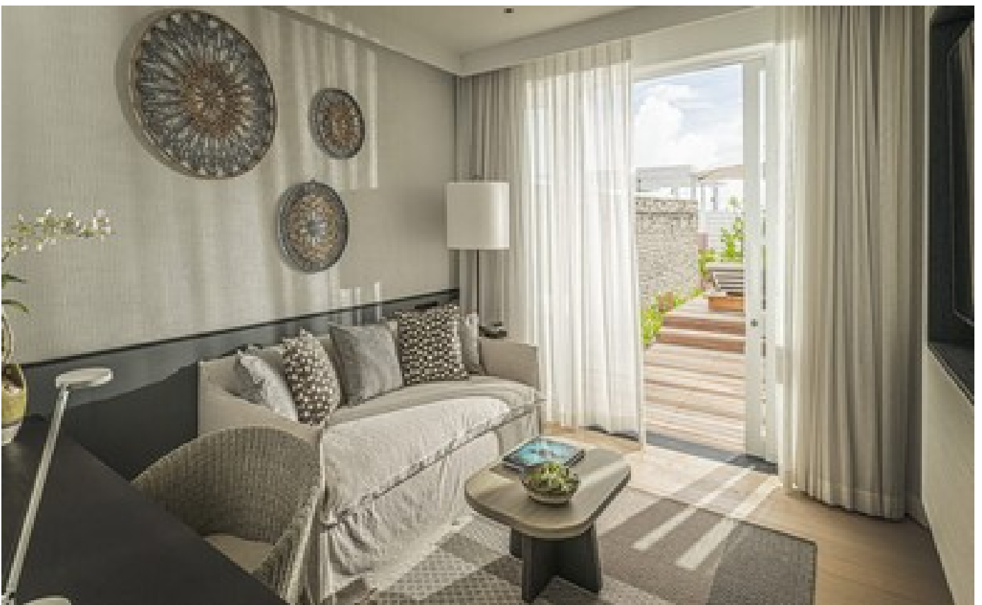
Two-Bedroom Oceanfront Bungalow - Partial Sea View