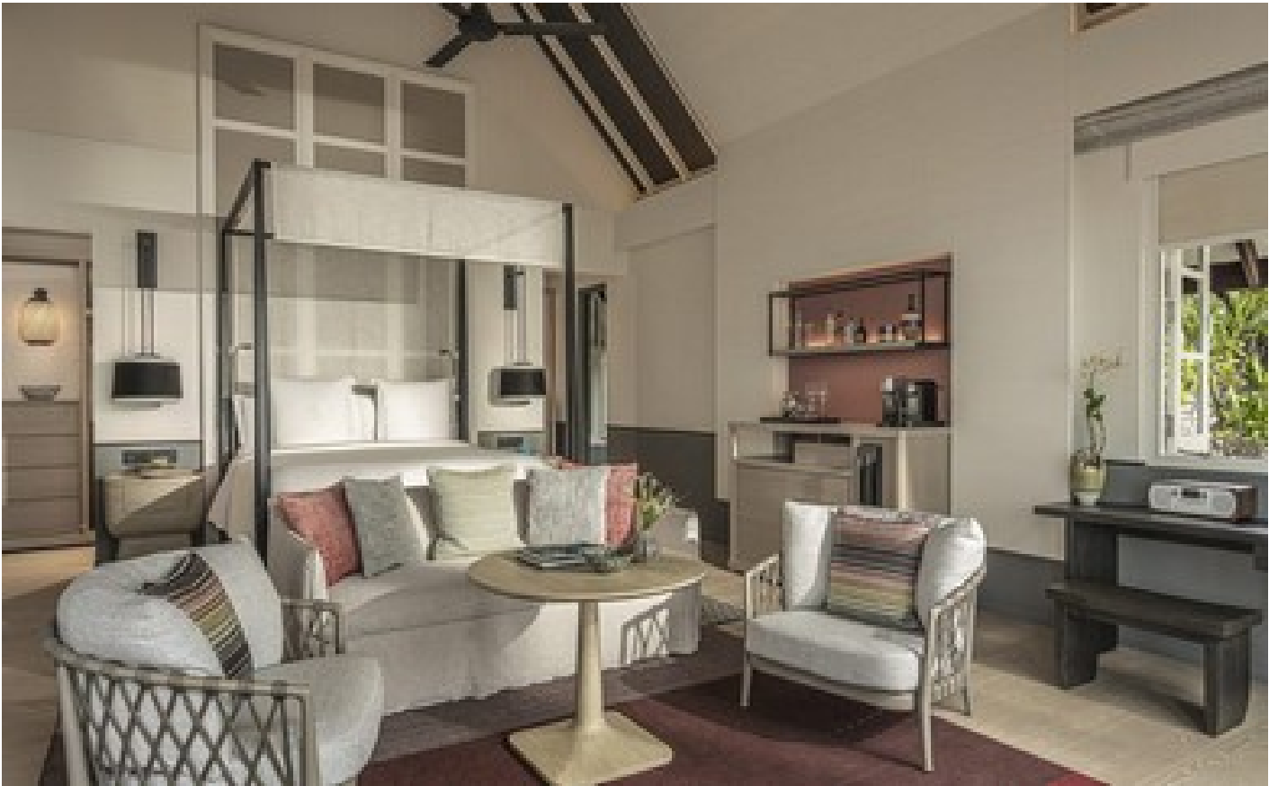
Family oceanfront bungalow with pool