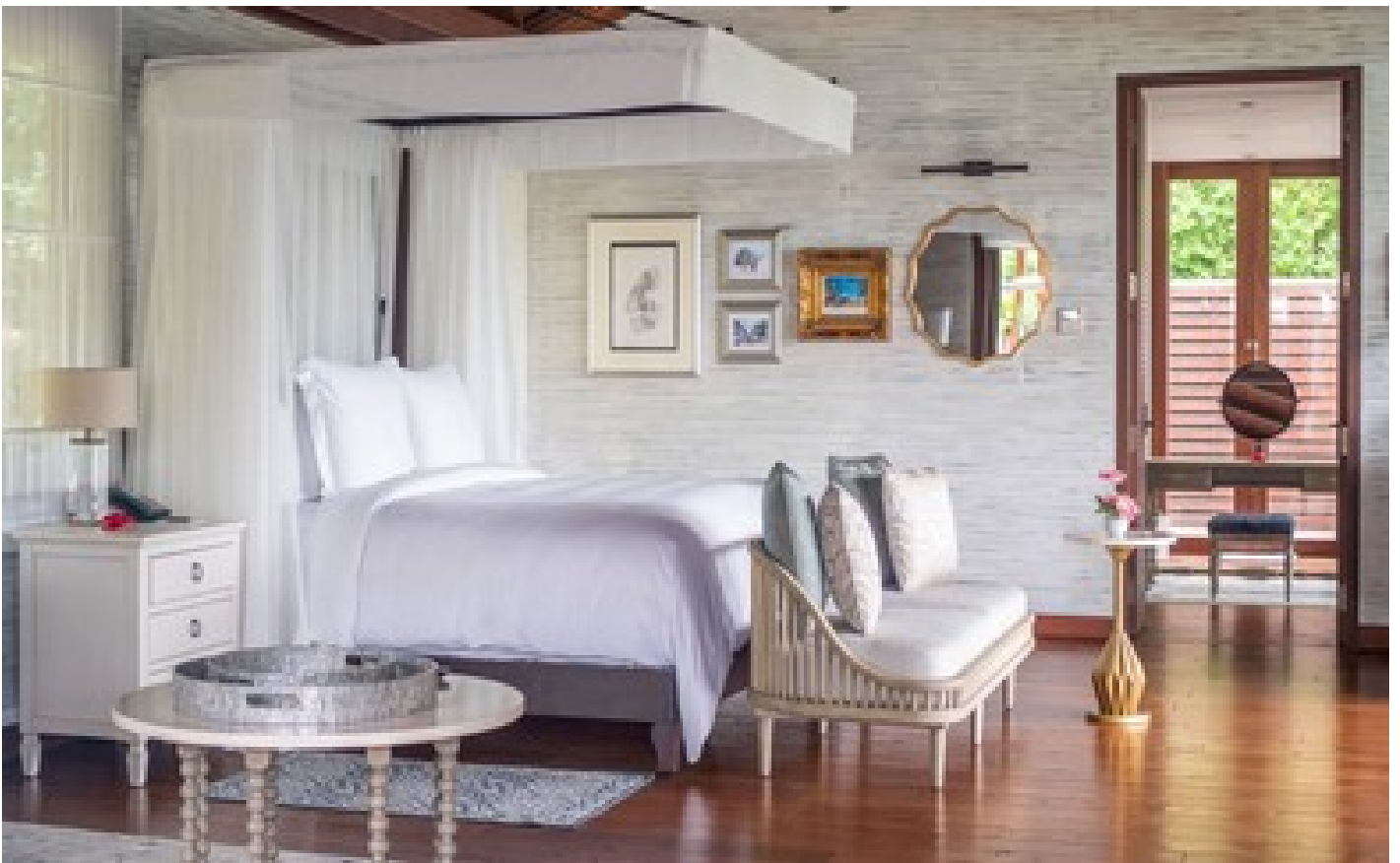
Two-Bedroom Hilltop Ocean-View Suite