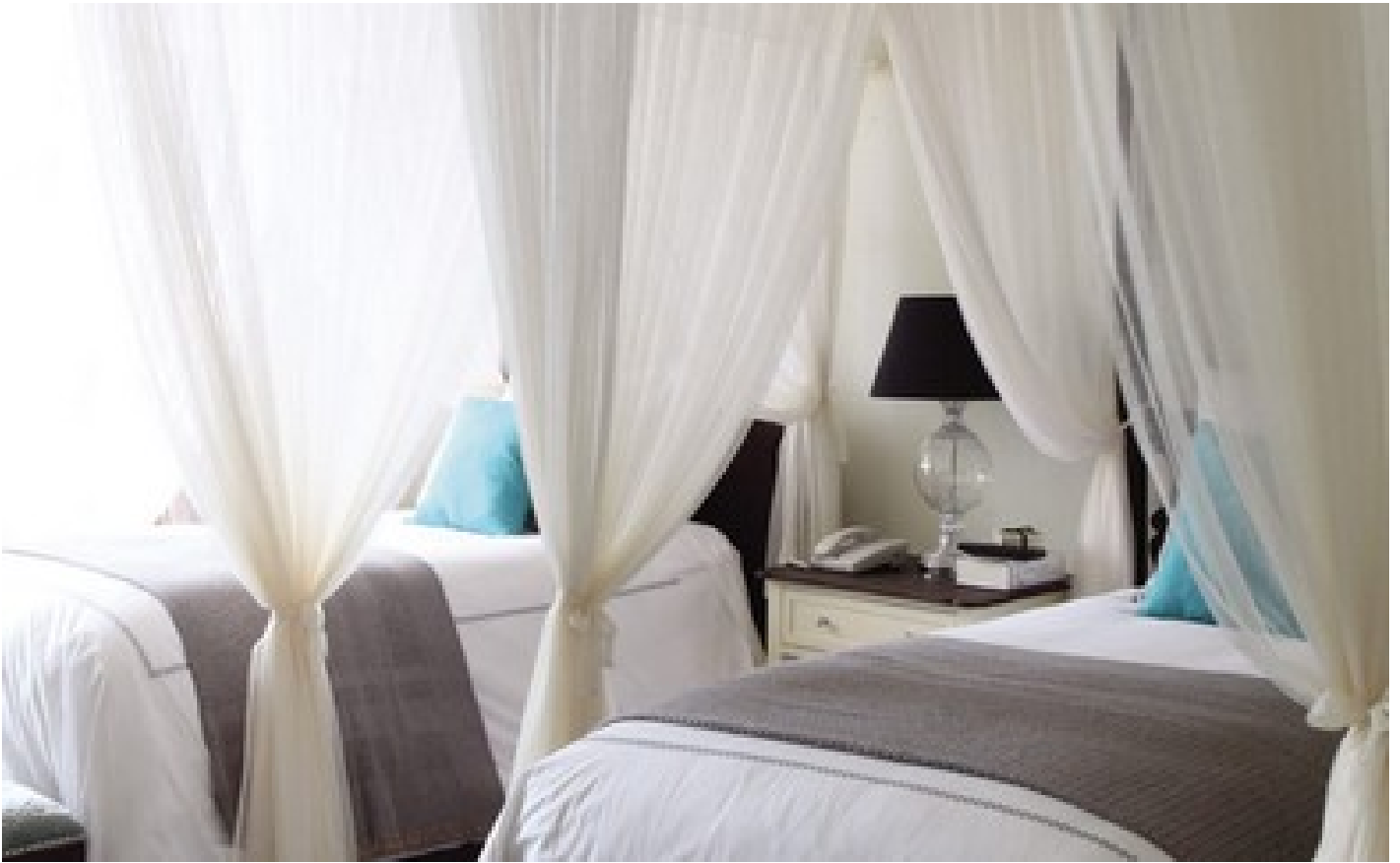
Three-Bedroom Presidential Suite