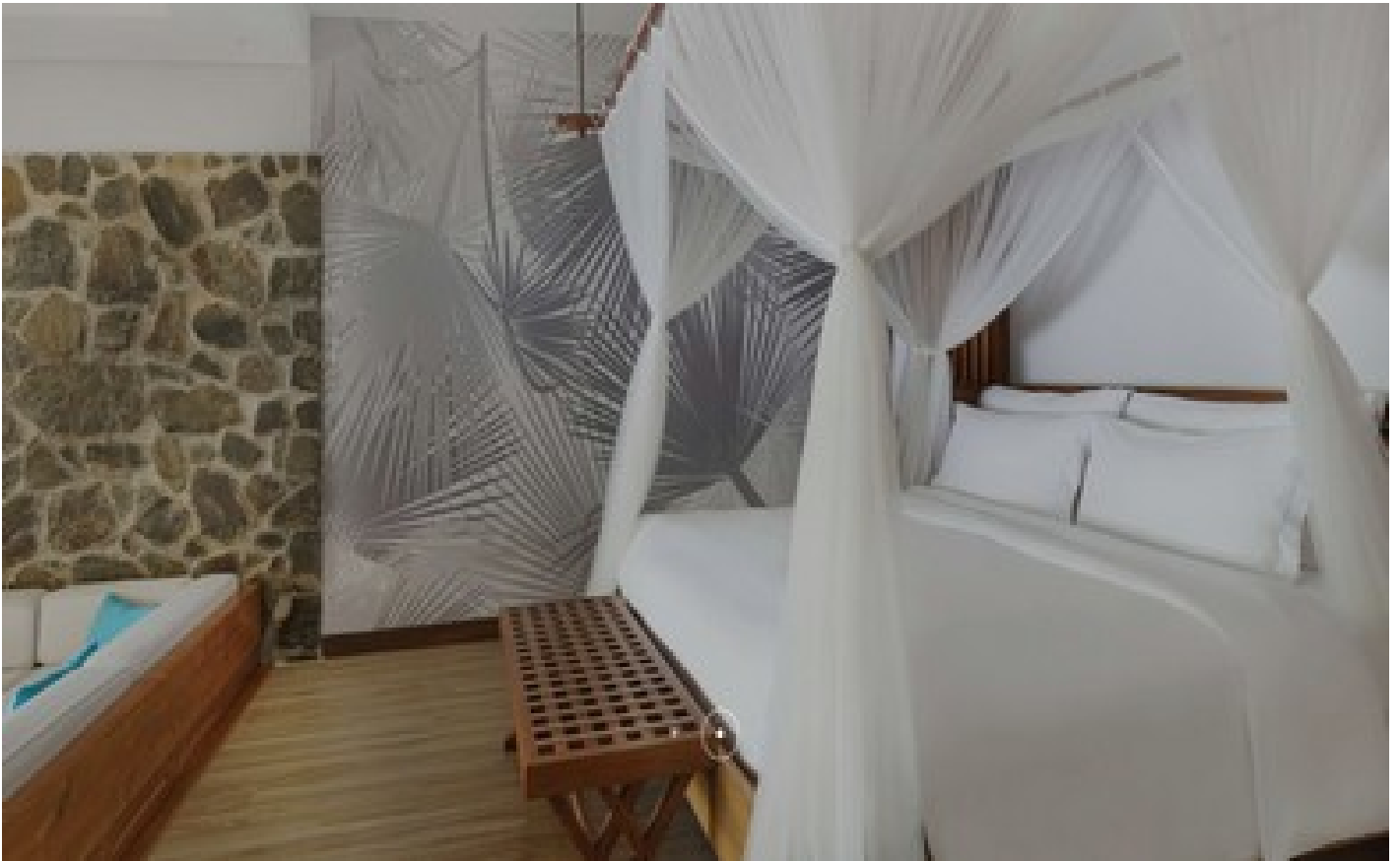
Deluxe Lagoon View Room