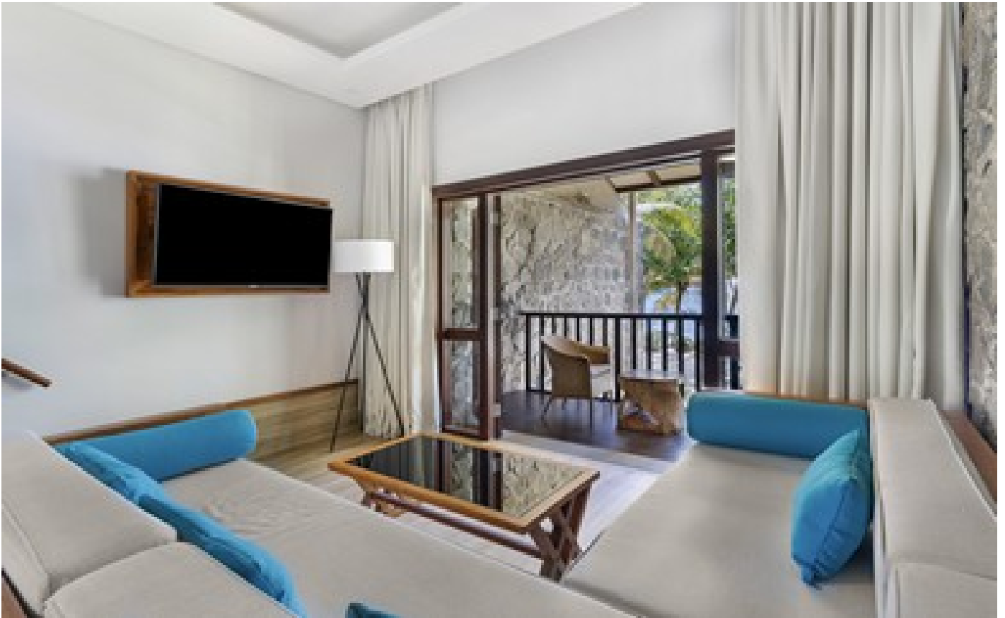
Deluxe Ocean View Garden Room