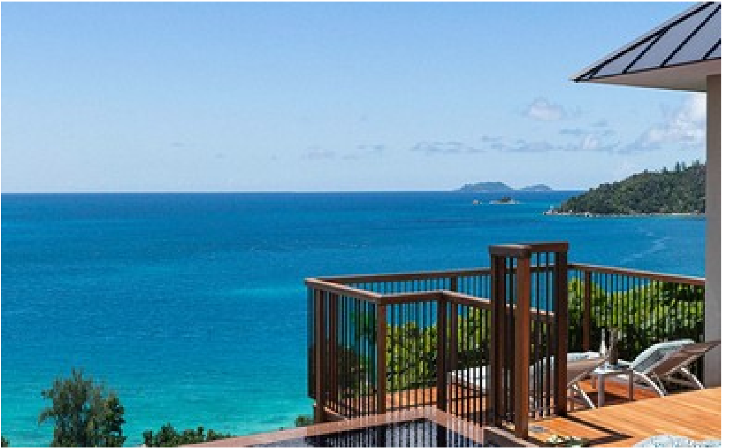
Grand Hillside Pool Villa