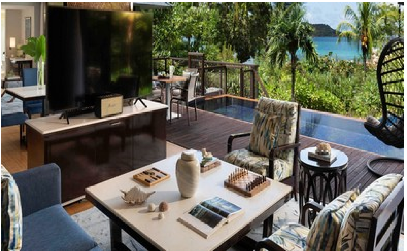
4 Bedroom Pool Residence