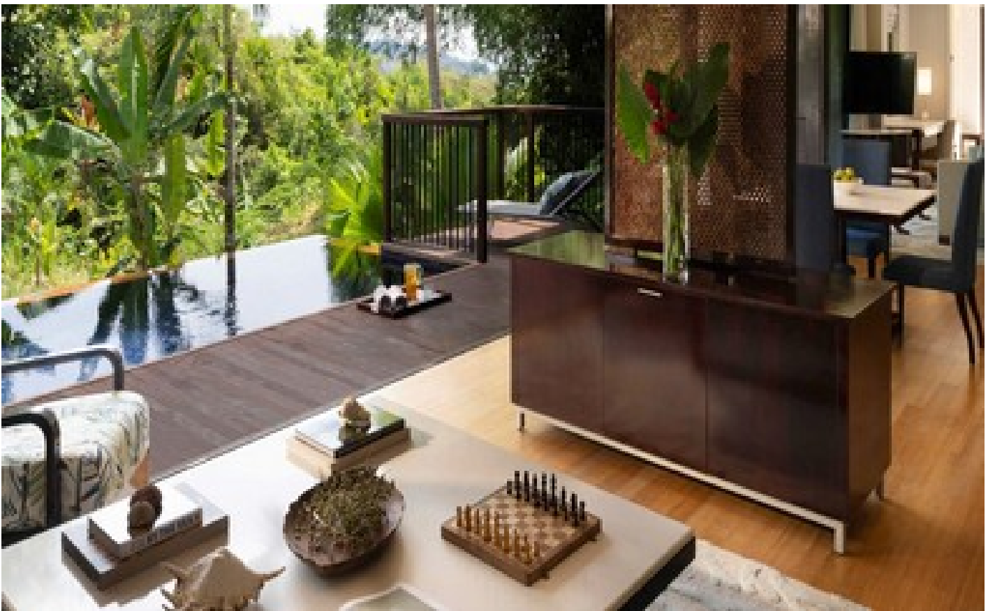
Grand Ocean View Pool Villa