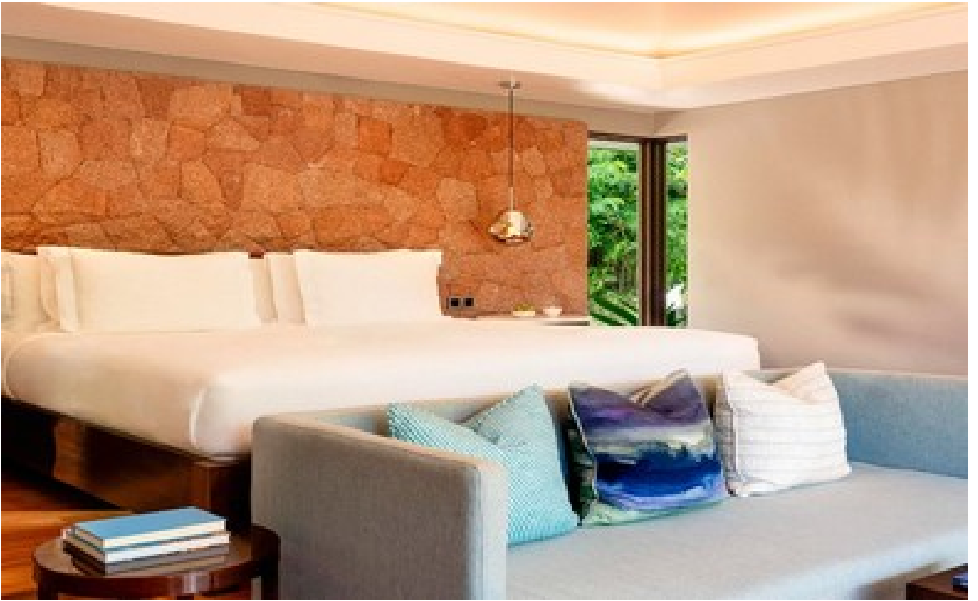
Ocean View Pool Villa - King