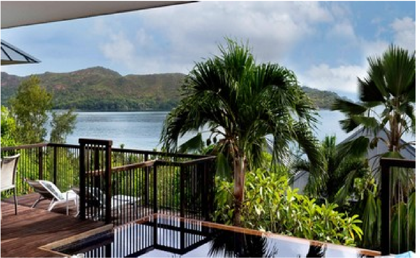
Grand Panoramic Pool Villa