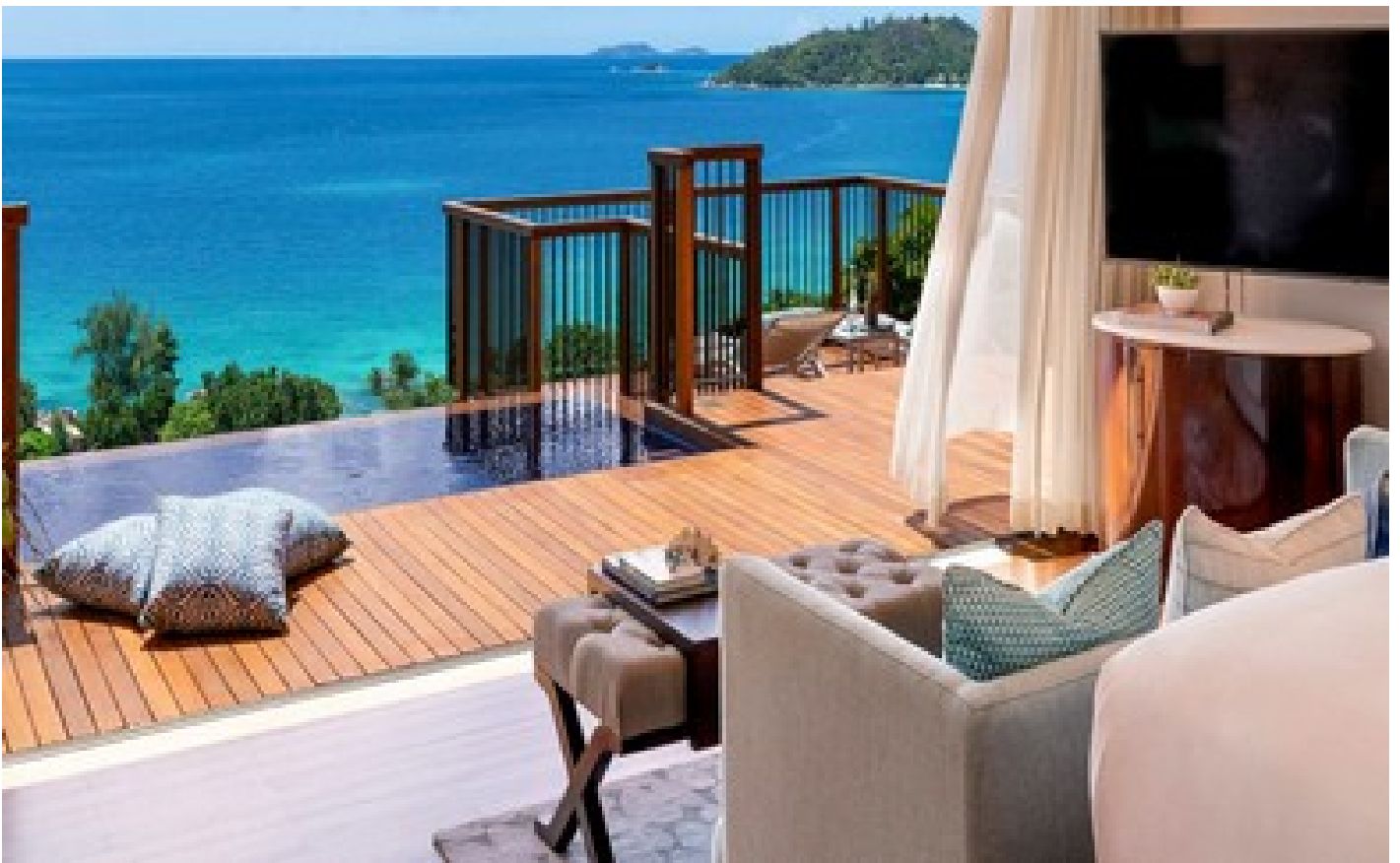
Panoramic Pool Villa - Twin