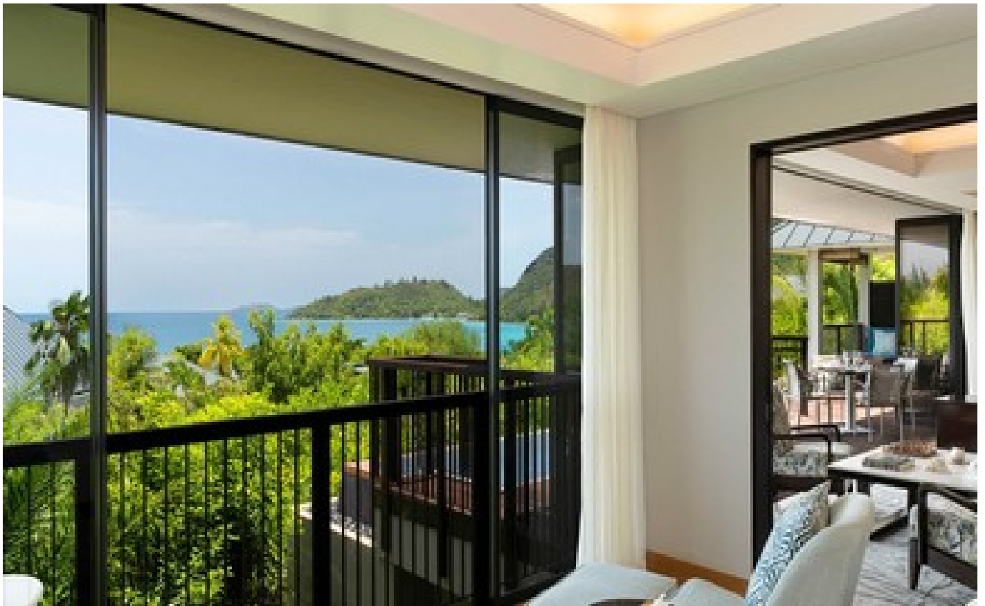
2 Bedroom Beachfront Pool Villa