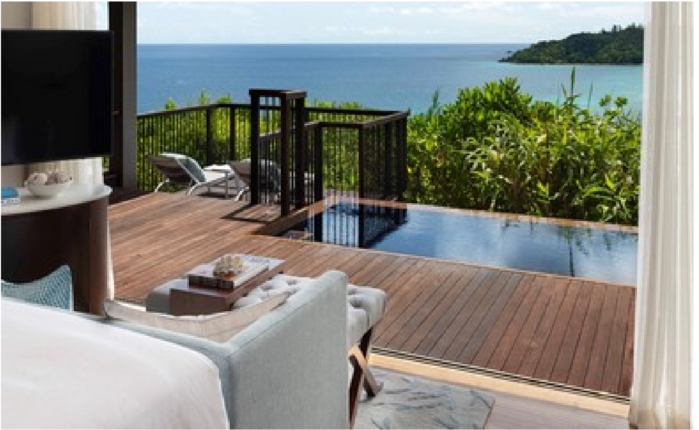
Panoramic Pool Villa - King